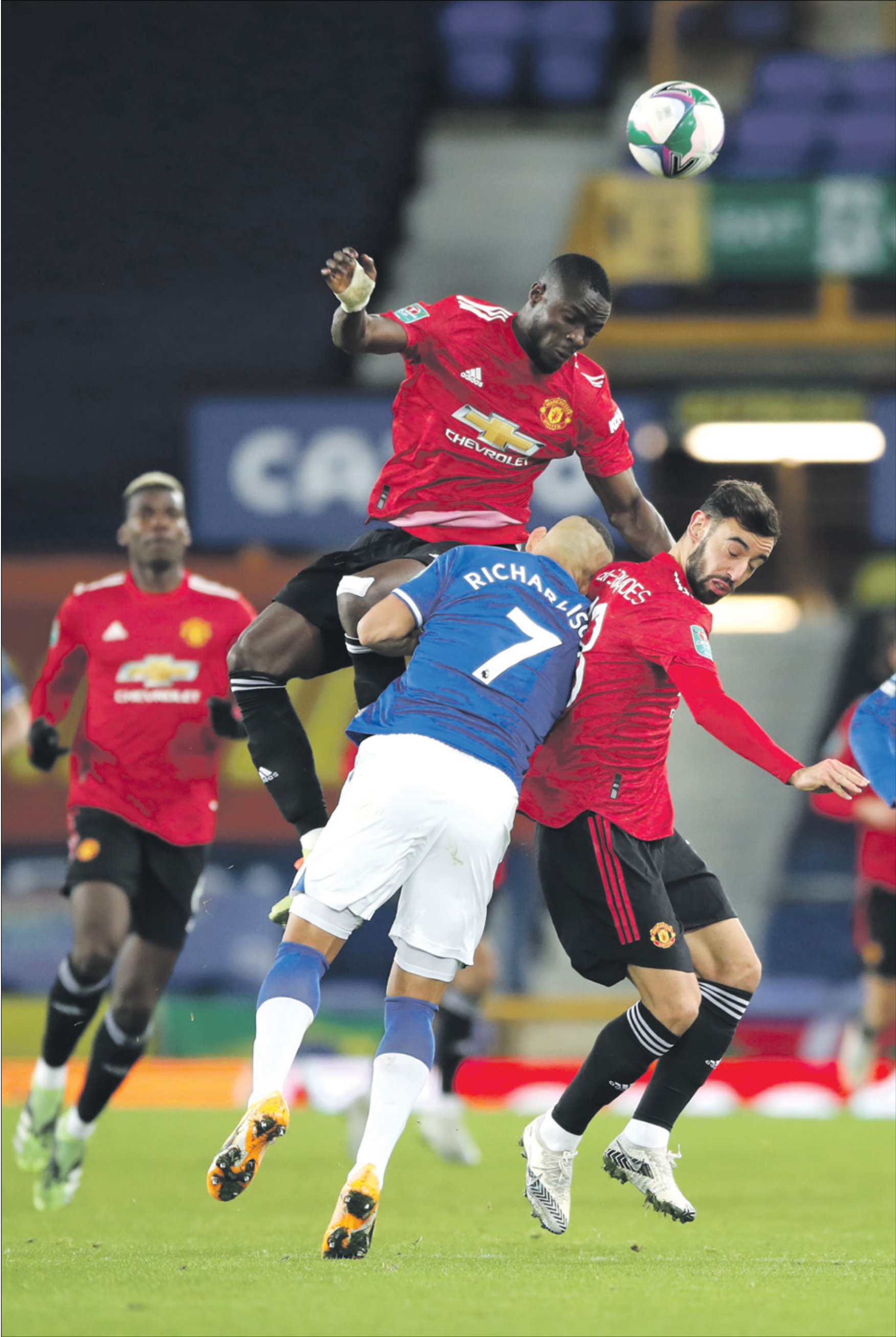
مواجهة نارية مُنتظرة في ملعب «ولد ترافورد»

تشهد الجولة الـ 23 من منافسات بطولة الدوري الإنكليزي لكرة القدم مواجهة قوية ومُرتقبة بين مانشستر يونايتد وصيف برصيد 44 نقطة وإيفرتون صاحب المركز السابع برصيد 36 نقطة. ويسعى فريق «الشياطين الحمر» لمتابعة سلسلة النتائج الجيدة والمنافسة على اللقب هذا الموسم، بينما سيحاول «التوفيز» خطف الانتصار الذي يقرهم من الصدارة مع مباراتين مؤجلتين.