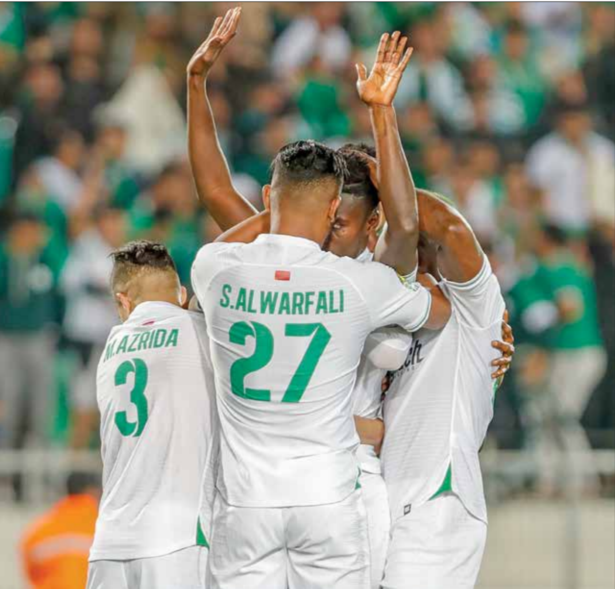
الرجاء حسم مواجهته أمام بيراميدز برفق عبد المجيد/ فرانس برس

بعد اللقاء: «شكر اللاعبين على دعمهم الكامل وموقفهم طوبوا مني البقاء بعد إطلعتهم رغبتي في الرحيل، لكنّ موقفهم