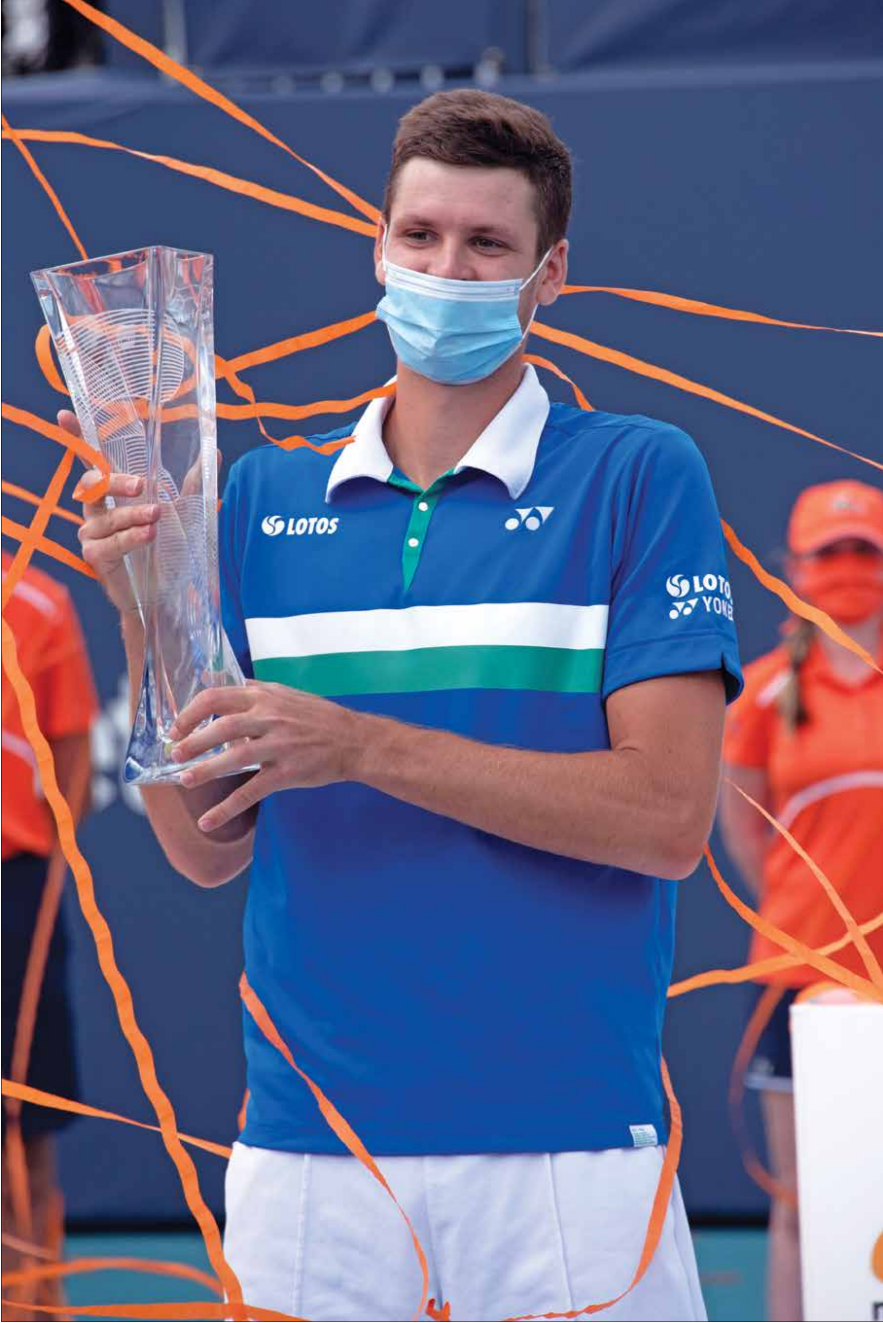
أكمل اللاعب البولندي المفاجأة وتوج بلقب

كله البولندي هورت هوركاتش مسيرته الرائعة في بطولة ميامي المفتوحة لتس الاساتذة، ذات ال1000 نقطة، بالتتويج بلقب إثر فوزه في المباراة النهائية على الإيطالي يانيك سينر بمجموعتين دون رد، ليدشن القاب في بطولات الماسترز. واحتاج صاحب ال24 سنة لساعة و44 دقيقة من أجل حفر اسمه ضمن المتوجين بلقب البطولة بنتيجة (7 - 6)، (7 - 4) و(6 - 4).