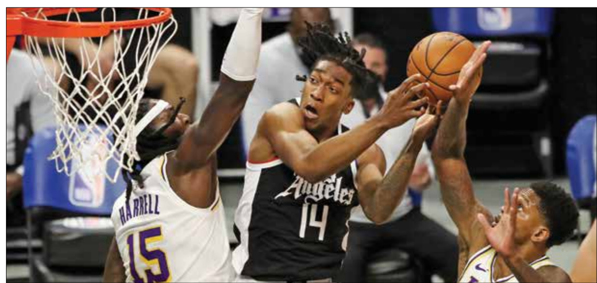
لوس انجليس كليبرز يحتك المركز الثالث من ترتيب المنتصه الغربية

العطاة 12 متتابعة، فيما كان أفضل مسجل ديلون بروكس مع 17 نقطة وفي مباراة أخرى، صعد غريزبانز للمركز الثامن متساويًا مع فريق سان أنطونيو سبيرز 24نقرا و23 هزيمة، وأمام غولدن ستايت ووريورز، العاشر الذي تعرّض لخسارة الثالثة تواليا أمام أتلانتا هوكس (117-111)، بالرغم من أنه استطاع نجه ستيفن كوري، وأنتون كوري فرصة تسجيله 37 نقطة للإشادة بالحالية الأسبوية في أتلانتا بعد حادثة إطلاق نار في ثلاث صالات للتدليك أسفرت عن مقتل عامنة أشخاص، من خلال ارتداء حذاء رياضي رسم عليه صورة لاسطورة الفنون القتالية بروس لي وعائلته مرفقة بكتابة «تحت السماء، هناك عائلة واحدة فقط».