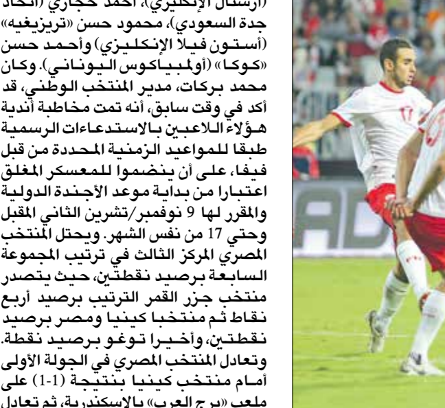
منتخب مصر يحك المركز الثالث في المجموعة السابعة

وتعادل المنتخب المصري في الجولة الأولى امام منتخب كينيا بنتيجة (1 - 1) على ملعب «برج العرب» بالإسكندرية، ثم تعادل