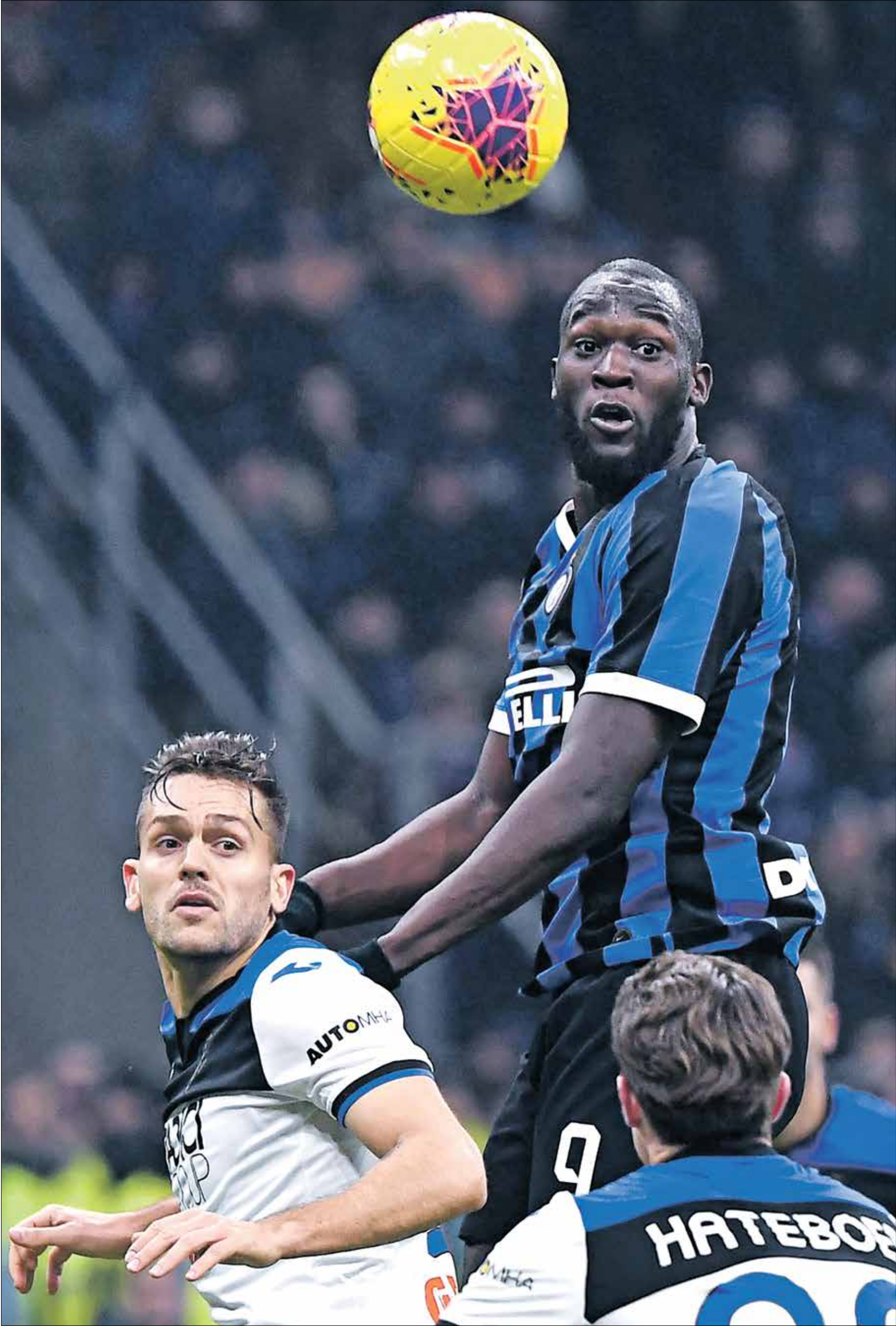
كل فريق، يحتاج للقاط الكاملة بغية الاستمرار في المنافسة

تشهد الجولة السابعة من منافسات بطولة الدوري الإيطالي مواجهة منتظرة وقوية بين فريقي أتلانطا وإنتر ميلان للمنافسة على مراكز متقدمة في الترتيب. ويحتل أتلانطا المركز الرابع برصيد 12 نقطة، بينما يملك «النيراتزوري» 11 نقطة في المركز السادس، وتبرز قوة هجوم الفريقين بتسجيل الأول 17 هدفاً والثاني 15 هدفاً حتى الآن.