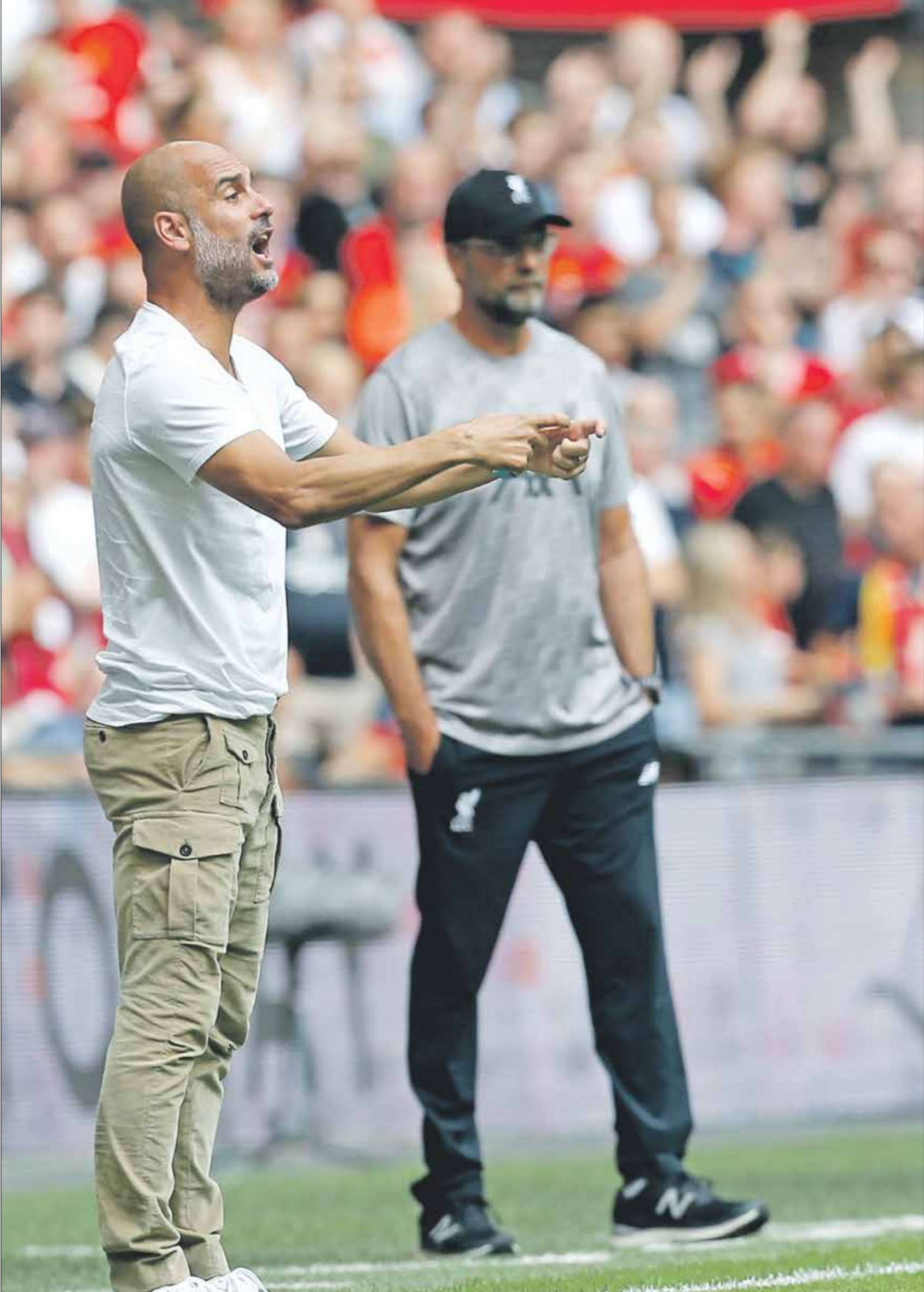
من سوفوز في أول مواجهة هذا الموسم بين كلوب وغوارديولا؟

فمن سيحسم القمة الإنكليزية المنتظرة ومن سوفوز في أعلى نقاط في الموسم الجديد، بيب غوارديولا أو يورغن كلوب؟