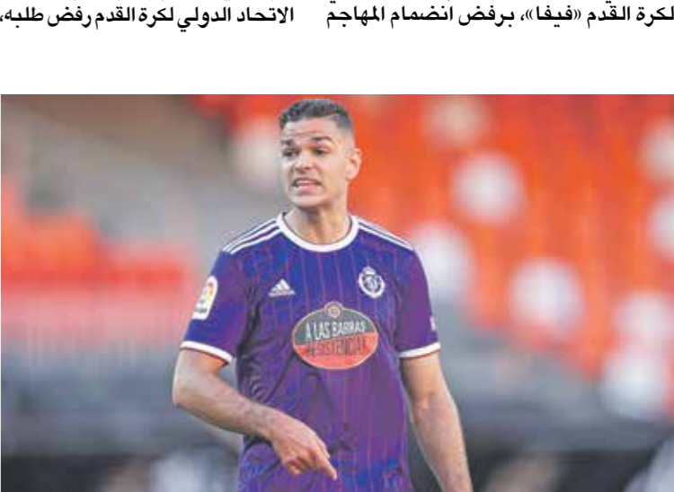
لم يسجِب بن عرفة لطلب الاتحاد التونسي في عام 2006

إلى صفوف «أسود الأطلس» في شهر أكتوبر/ تشرين الأول الماضي. وحاول منير الحدادي الاستفادة من قانون السماح بتغيير المنتخب لأصحاب الجنسية المزدوجة بشروط محددة، لكن الاتحاد الدولي لكرة القدم رفض طلبه، بسبب