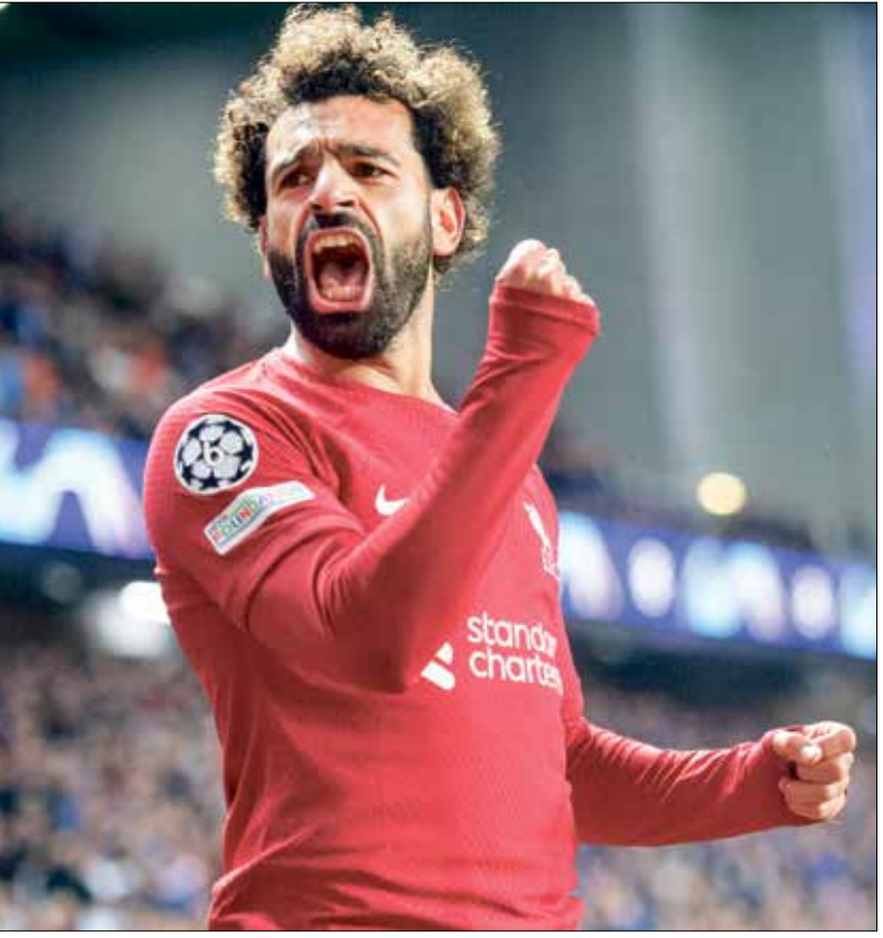
يواصل صلاح تألقه في البريميرليغ

يحتل صلاح المرتبة الرابعة في قائمة اصحاب «الأسيسست»