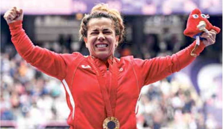
روعة التليلج، اهدت تونس الذهب مرتين في باريس

عالمياً جاءت المغرب، التي نالت 15 ميدالية متنوعة، وكانت الأعلى عربياً حصداً للميداليات، بواقع ثلاث ذهبيات وست فضيات وست ميداليات برونزية. وفي المركز الرابع عربياً تأتي مصر بالحصول على المركز الحادي والأربعين، ونالت سبع ميداليات بواقع ميداليتين ذهبيتين وميداليتين فضيتين وثلاث ميداليات برونزية. وفي المركز السادس عربياً ظهر الأردن، الذي حقق المركز الثامن والأربعين عالمياً، ونال ثلاث ميداليات، بواقع ميداليتين ذهبيتين وواحدة برونزية.