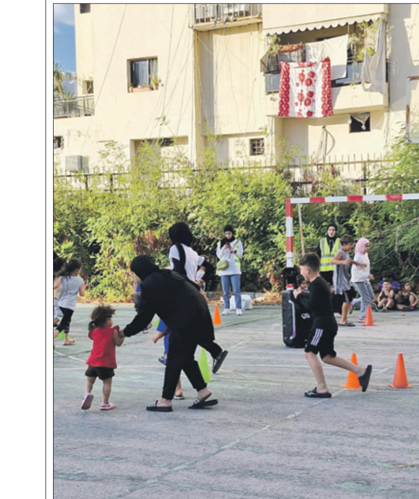
نشاط بدني للاطفال في صيدا

للقوانين حرب ظلت عقولهن المتحمسة بالحياة والنجاة تقول إنهن لن تتوسع. يتن حديدتها في رأي اللبنانيين. يعيشون الآن في «المؤقت»، وهم على مجموعات مستقلة من الحجاز بحسب كل التعاريف الدنيوية والفقهية والفلسفية وغير ذلك. فتيات هذه المجموعة يعثن فرأغاً وانتظارا ووقتاً ضائعاً وأماً في استعادة مفقودات بات يصعب تحديدها. صباكن من لبنان، ومصر، والمانيا، والبرازيل. حيوات تختصر في «نشأت» على انساب وصور يشاركنها للقول إنهن بخير رغم كل شيء.