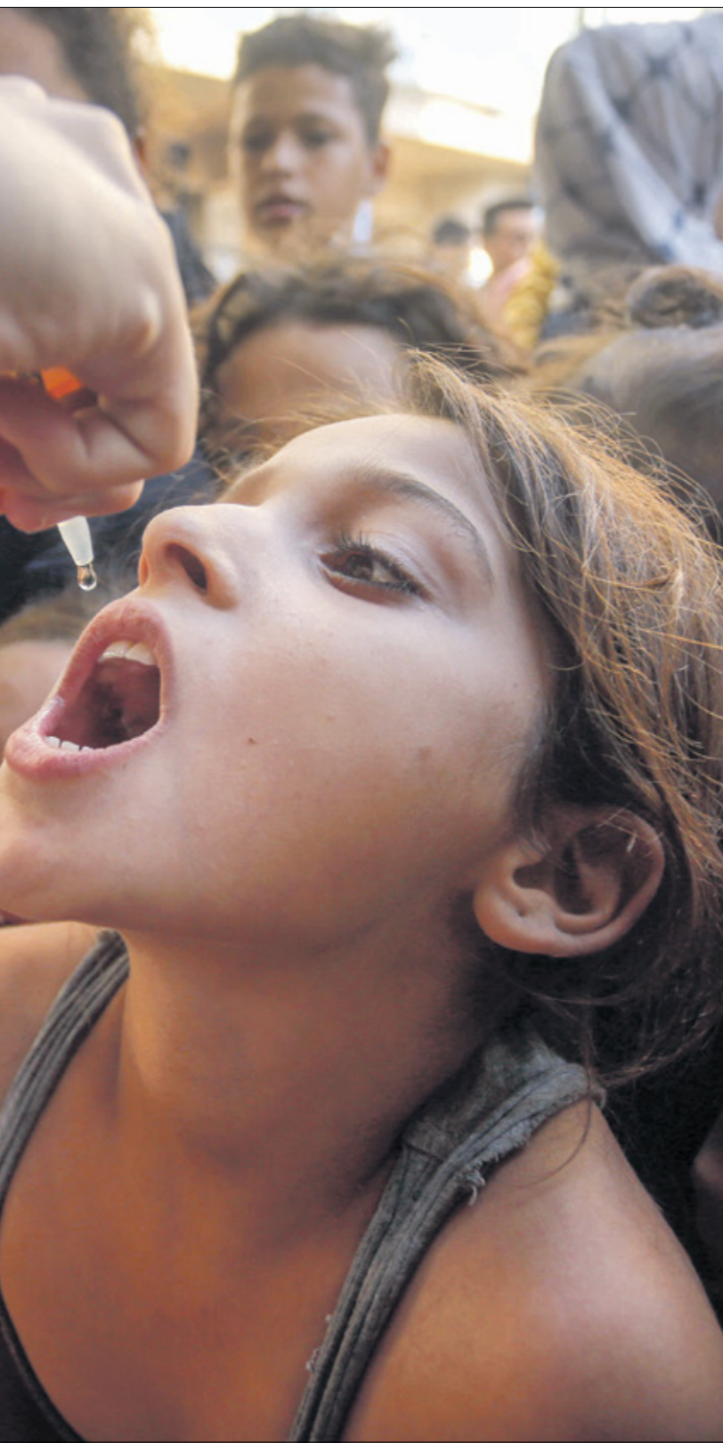
بدء المرحلة الثانية من التطعيم ضد شلل الأطفال في غزة

من الأوضاع المعيشية والصحية وتبدي المصوالي خشيتهما من استمرار الحرب مع دخول فصل الشتاء وتداعياته على الأطفال الصعب والفقيرات، لا سيما الإفقوترا والأوبئة بفعل الكثافة السكانية.