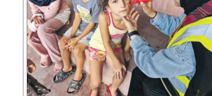
رسم على الوجوه

تساعد أنشطة التفریح النفسي الاطفال النازحين إلى مدارس في مدينة صيدا، على جنوب لبنان، على التعبير عن انفسهم ومخاوفهم، هم الذين اختبروا العنف والخوف والهرب