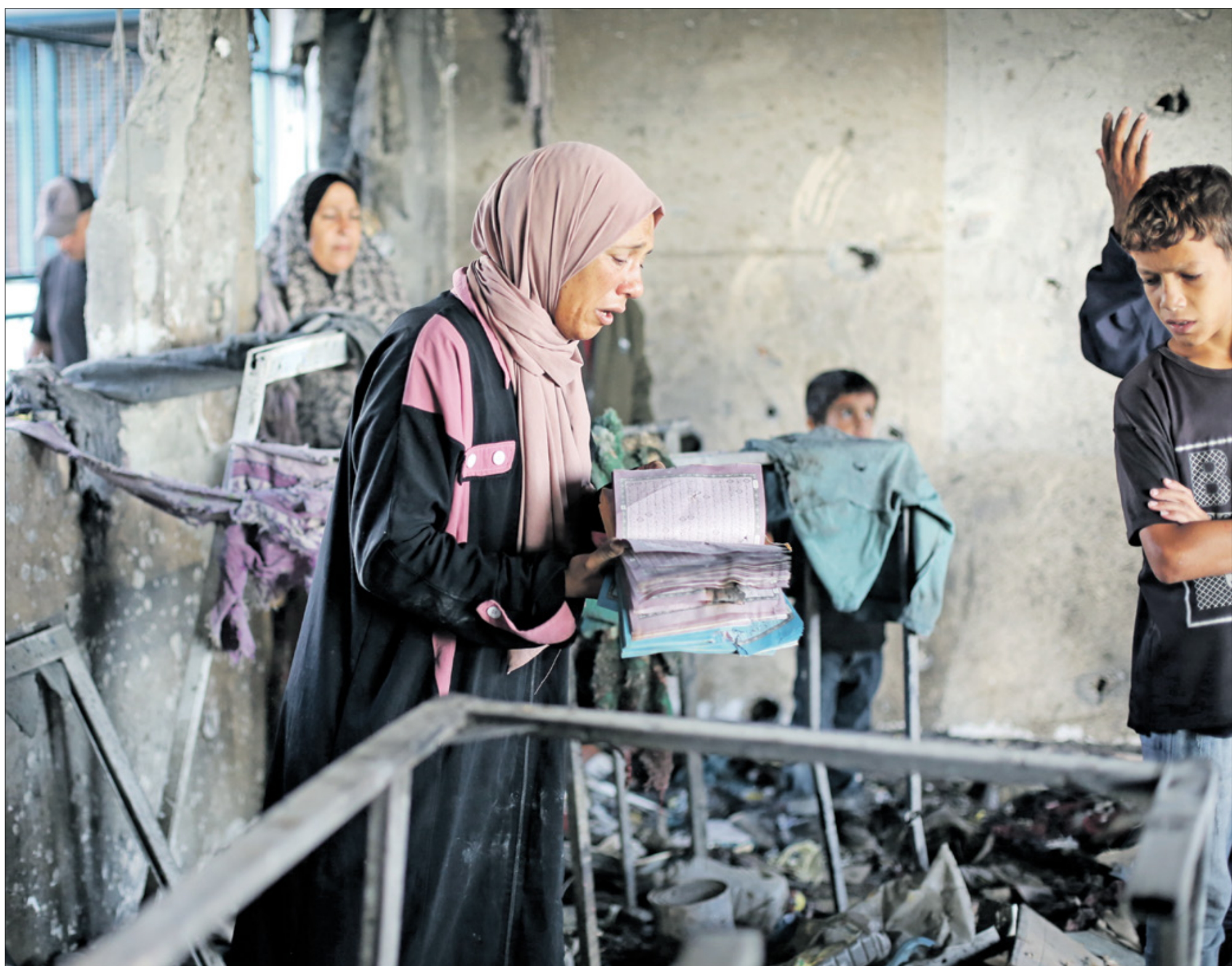
بعد قصف المدرسة التي تؤوي لنازحين (حسب الجديد)

«ليلة أخرى من الرعب»، هكذا وصفت وكالة الأمم المتحدة لغوث وتشغيل اللاجئين الفلسطينيين «أونروا» قصف إسرائيل النازحين في ساحة مستشفى شهداء الأقصى بدير البلح ومدرسة المفتي بمخيم النصيرات وسط قطاع غزة. وقالت الوكالة: عبر منصة إكس: «ضربة استهدفت ساحة مستشفى (شهداء الأقصى)، حيث اشتعلت النيران في الخيام التي كان