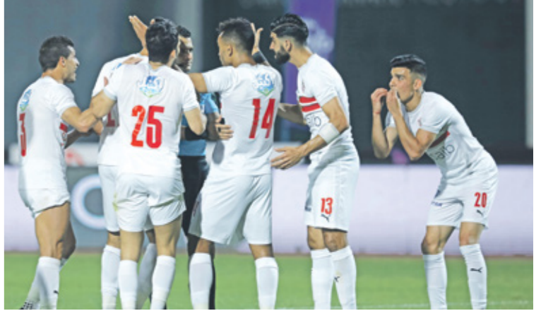
الزمالك يحذ ضيفا على توسكر الكينغ

شباب بلوزداد الجزائري يبحث عن إنجاز بالنسخة الجديدة