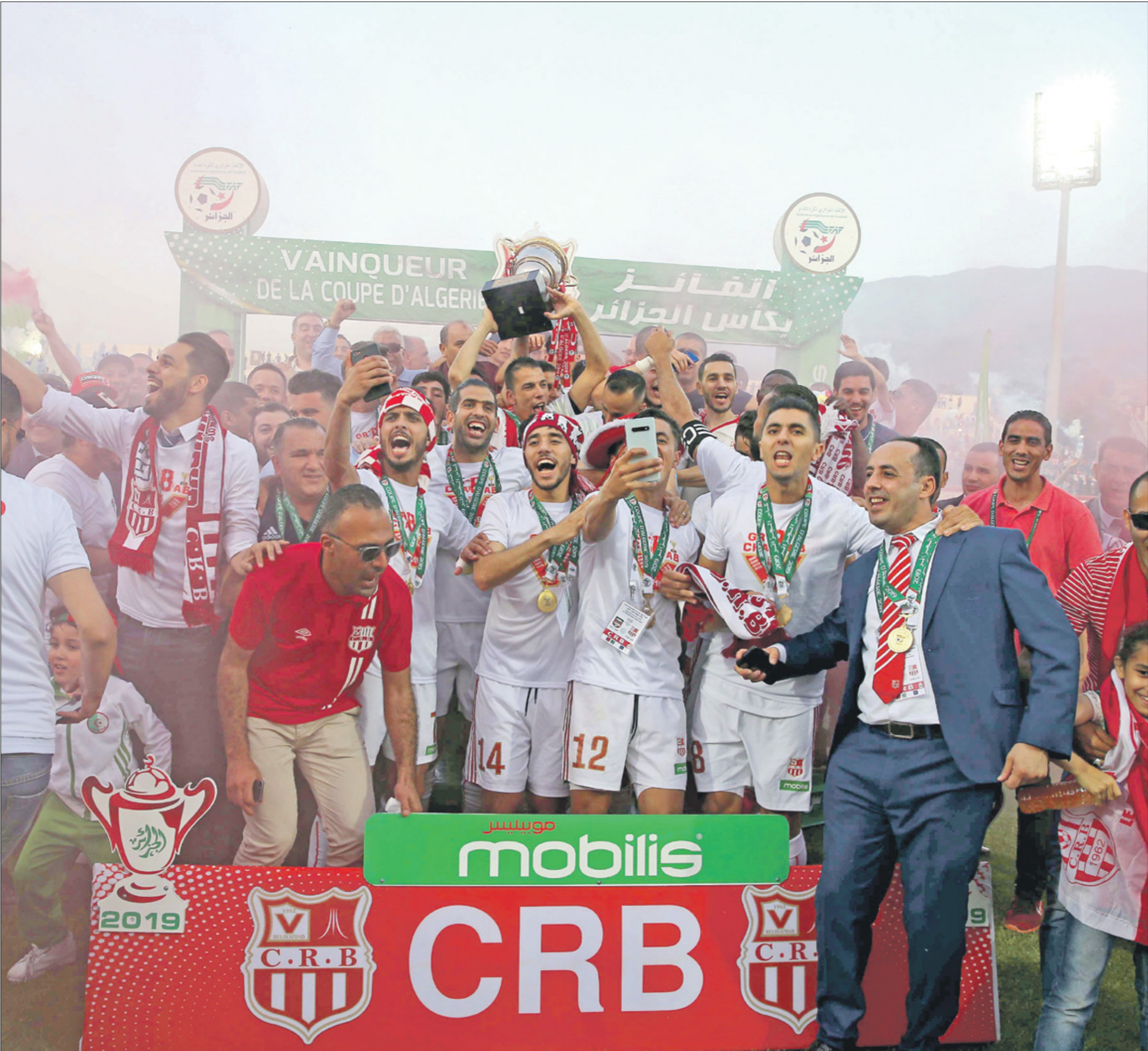
بلوزداد الجزائري يواجه اسك ميموزا العاجي

زرع منتخب الأردن تحت 23 عاما لكرة القدم، والذي يطلق عليه المنتخب «الريديف»، أصلا حديثا في الكرة الأردنية، بعد النتائج الجيدة التي حققها في المشاركة الأخيرة حين حقق لقب بطولة غرب آسيا، بعد الفوز في النهائي على المنتخب السعودي بنتيجة 1-0. وساد التفاؤل الشارع الرياضي الأردني بشكل عام بعد هذا التتويج، كما ساهمت النتائج الأخيرة للمنتخب الأول أيضا في إثبات فوزين على منتخبي ماليزيا والبرازيل، بعد أن ألقاب وأضاف: «المنتخب الأردني حقق فوزين على المنتخب البرازيلي الذي حقق فوزين على منتخبي ماليزيا وأستراليا». بعد أن ألقاب وأضاف: «المنتخب الأردني حقق فوزين على المنتخب البرازيلي الذي حقق فوزين على منتخبي ماليزيا وأستراليا». بعد أن ألقاب وأضاف: «المنتخب الأردني حقق فوزين على المنتخب البرازيلي الذي حقق فوزين على منتخبي ماليزيا وأستراليا».