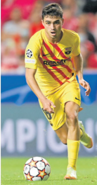
بيدري بات احد نجوم برشلونة