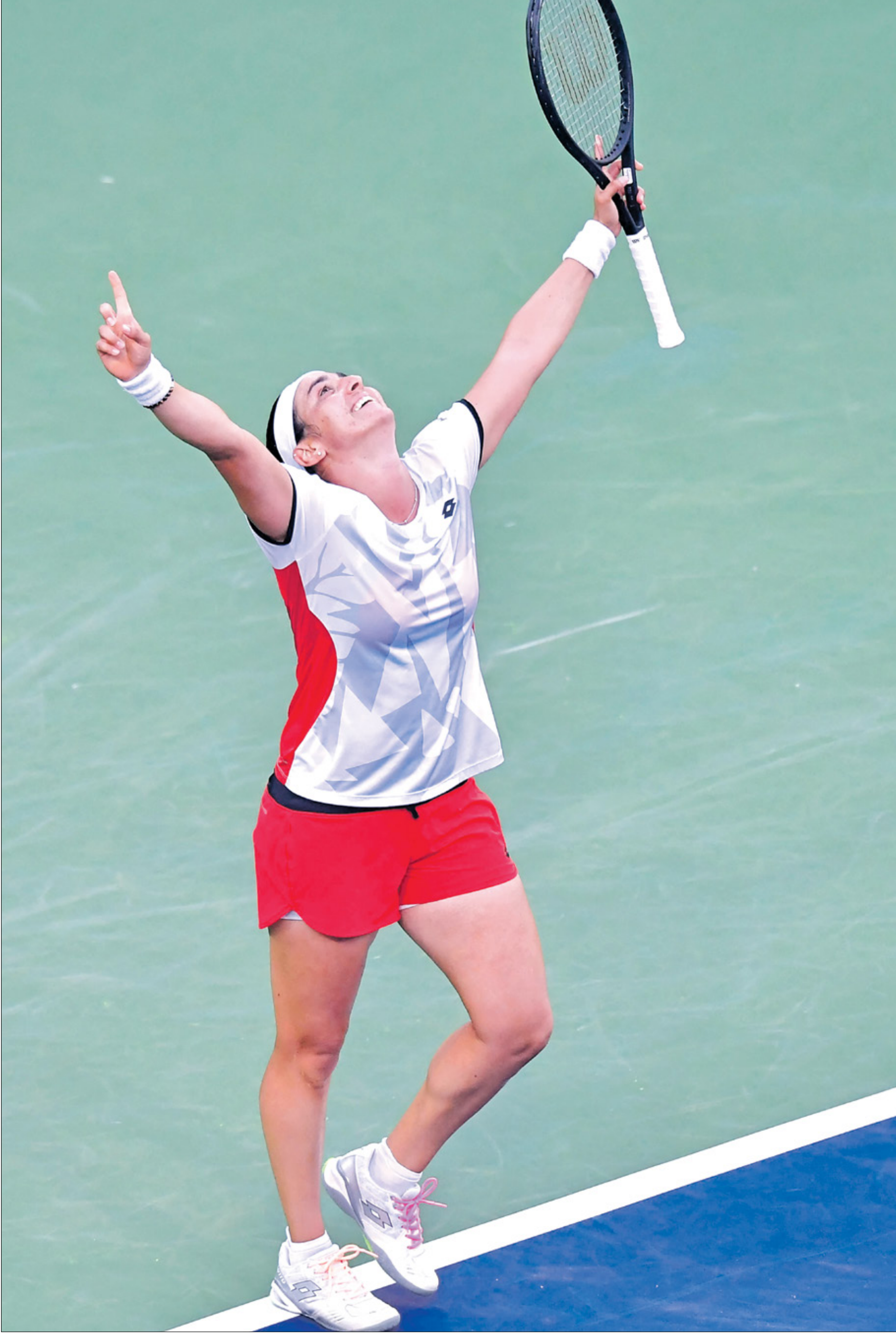
انس جابر واصلت تألقها بعالم الكرة الصفراء

دخلت النجمة التونسية انس جابر، قائمة المصنفات المحترفات العشر الأوليات على مستوى العالم، لأول مرة في تاريخ التنس العربي، لتحقيق إنجازا جديدا بعدما اصبحت اول لاعبة عربية تفوز بلقب في بطولات المحترفات، عندما نالت لقب برمنغهام في يونيو/حزيران الماضي.