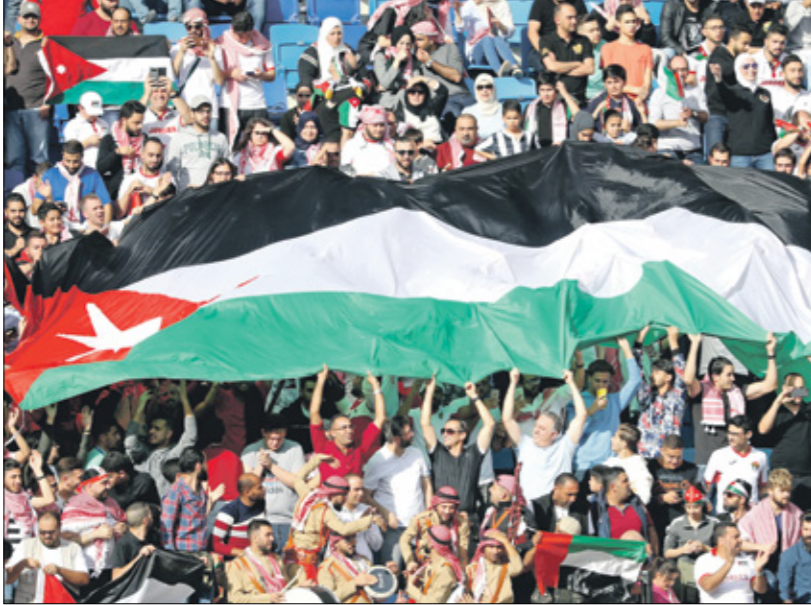
رديف الشامه حصد لقب غرب آسيا على حساب السعودية

قدمه النشامى من عطاءات كبيرة سواء قبل انطلاق المنافسات او على استردادها. وقال المدرب الأردني الشاب في تصريحات خاصة للموقع الإلكتروني لإتحاد غرب آسيا، إن البطولة كانت من الأساس فرصة مميزة لكافة المنتخبات المشاركة للوقوف على مستوى جاهزيتها قبل الظهور في التصفيات المؤهلة إلى نهائيات كأس آسيا تحت 23، وجاءت بالنسبة للمنتخب الأردني على وجه التحديد محطة مثالية باعتباره خاض سلسلة من المباريات القوية وحصل بالنهاية على اللقب وهو ما أضاف مكنتسات إيجابية على الصعيد المعنوي جنباً إلى جنب مع ما تحقق من فوائده على الشقين الفني والبدني. وعاد هائل ليقدم تنظيم البطولة بعد انقطاع 6 سنوات، إلى جانب اختيار توقيت مناسب لها يسبق التصفيات وتوقيت المنتخب الأردني توج باللقب بعد الفوز على المنتخب السعودي بنتيجة 1-3، في المباراة النهائية التي أقيمت في 12 تشرين الأول/ أكتوبر الجاري، وهي أسد الأبرص محمد بن فهد بالأمم، وشهدت البطولة مشاركة واسعة وتأملت 11 منتخبا من أصل 12 بملتون كافة الاتحادات المنضوية تحت مظلة اتحاد غرب آسيا، وهي: الأردن، السعودية، فلسطين، العراق، البحرين، الإمارات، عمان، اليمن، الكويت، البحرين وليجان.