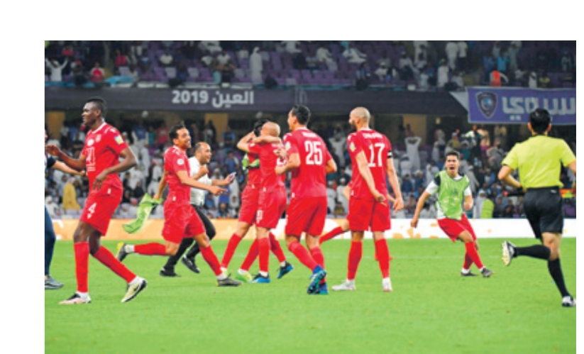
النجم الساحلي يحذ ضيفا على ازمع الرواندي

تنتظر الجماهير في «الشمال الأفريقي» انطلاق جولة عربية جديدة، عبر مباريات ذهاب مرحلة الـ 32 لدوري أبطال أفريقيا لكرة القدم موسم 2021-2022، والذي سيشهد الظهور الأول للعديد من الأندية العربية الكبرى، ممن جنبتها القرعة التواجد في الدور التمهيدي الأول، بحثًا عن تدرشين ضربة بداية قوية، وحصد بطاقات التأهل إلى مرحلة المجموعات، والسير قدما في رحلة المنافسة. وحل النادي الأهلي المصري، حامل لقب البطولة في آخر نسختي 2020-2021، ضيفا