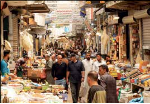
لا إجراءات احترازية في سوق باب السراي في الموصل