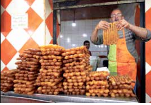
حلويات رمضان في الجزائر