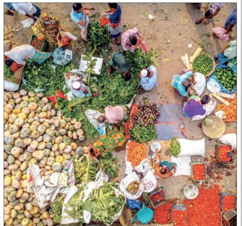
سوق الخضار في بنغلاديش