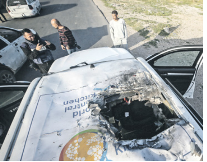
قتال عمال «الصليب الأحمر» في استهداف إسرائيل

قالت الأمم المتحدة إن الصراعات أودت بحياة عدد قياسي من عمال الإغاثة حول العالم خلال عام 2023، فيها دُوقف الهجمات على المدنيين وأن حصيلة عام 2024 مرشحة لتكون أكبر. وذكر مكتب الأمم المتحدة لتنسيق الشؤون الإنسانية «إوتشا» أن 280 عامِل إغاثة قُتلوا في 33 دولة خلال عام 2023. وهو أكثر من ضعف العدد المسجل في العام السابق، إذ سجل عدد القتلى زيادة بنسبة 137% عن عام 2022 (118 قتيلاً). وأفاد بيان أكثر من نصف وفيات العام الماضي سجلت خلال الأشهر الثلاثة الأولى من العدوان الإسرائيلي المتواصل على قطاع غزة، وقضى معظمهم في غارات جوية.