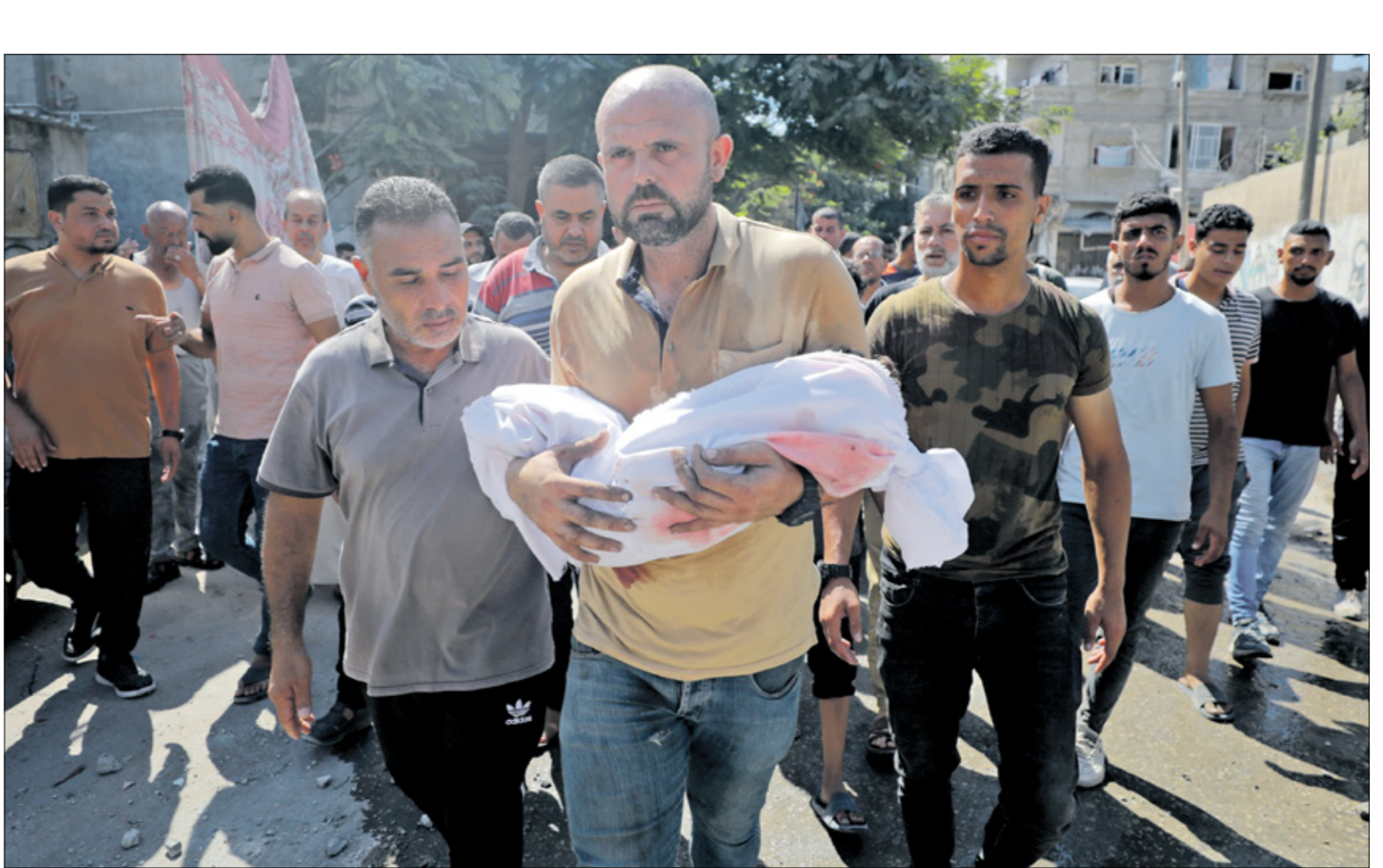
دير البلح، 16 أغسطس 2024 (حسب جدي/الناظر)

شهدت الأسابيع الأخيرة صعوبات عدة في دفن الشهداء بقطاع غزة، من بينها عدم وجود وسائل لنقل الجثامين، وعدم توفر مقابر فارغة