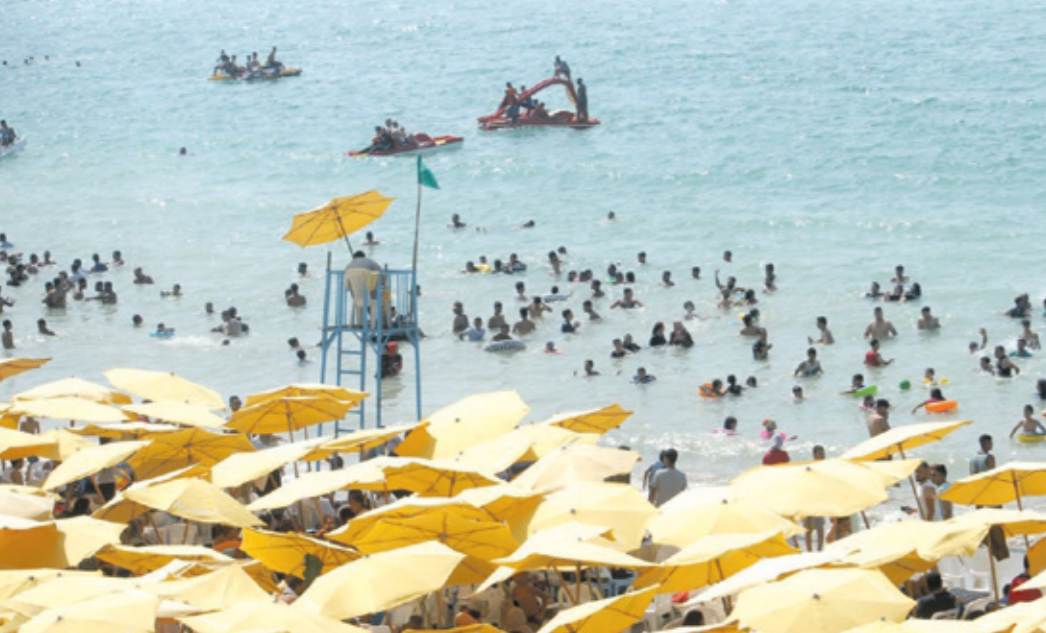
مغممة افراد الافراد صبية بسبب اخطاظ الشواطئ (الحرب الجديد)

فباإضافة إلى سوء الأحوال الجوية، وارتفاع درجات الحرارة التي جعلت أعداد المصطافين تفوق القدرات، يشكو عمال الإنقاذ من ضعف الإمكانيات والعدات.