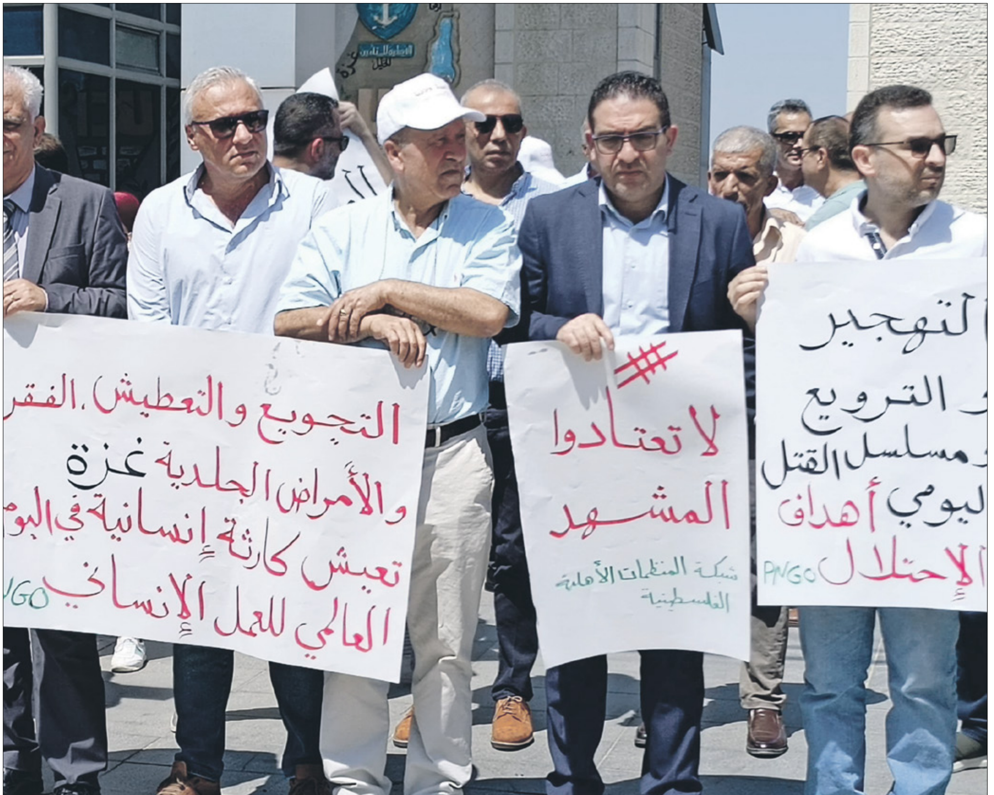
وقفة امام مكتب الأمم المتحدة في رام الله

وجهدت شبكة المنظمات الأهلية الفلسطينية، أمس الاثنين، نداءً إلى أنصار حقوق الإنسان والمؤسسات الأممية، لوقف العدوان على قطاع غزة، وخلال وقفة أمام مكتب الأمم المتحدة لتنسيق الشؤون الإنسانية «أوتشا» في رام الله. وجاء في مذكرة سلمها المنسق الإعلامي