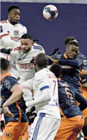
من سيجور في البطولة المنتظرة

يبدأ القضاء الأرجنتيني في فحص هاتفين خلويين يخصان دييغو مارادونا، الذي توفي في 25 تشرين الثاني/نوفمبر، لتحليل الإهمال المحتمل في علاجه الطبي، ويُحقق مكتب الدعى العام في سان إيسيدرو في تصرفات جراح الأعصاب ليوبولدو لوكي، والطبيبة النفسية أوغستينا كوساشوف، والطبيب النفسي كارلوس دايان، والممرضة ديانا غينزيلا مدريد والمرخص ريكاردو البيرون. وكان قد تم إيدخال مارادونا (60 سنة)، إلى عيادة في مدينة لا بلاتا في 2 تشرين الثاني/نوفمبر عام 2020 بسبب فقر الدم والجفاف وبعد يوم واحد تم نقله إلى مصحة في مدينة أوليبوس في بوينس آيرس، حيث أجري عملية جراحية على يد لوكي بسبب ورم دموي تحت الصفاق، وفي 11 تشرين الثاني/نوفمبر، خرج من المصحة، ولكن مع الإقامة في المنزل لمواصلة العلاج، وفي 25 تشرين الثاني/نوفمبر، توفي في منزل خاص في ضواحي بوينس آيرس، وخُصص تشريح الجثة إلى وفاته نتيجة «وئمة الرئة الحادة الثانوية لتفاقم قصور القلب المزمن»، ووفقاً لنتائج تحليلات السموم التي أجريت، فإن بطل العالم 1986 مع الأرجنتين في المكسيك لم يكن لديه كحول أو مخدرات في جسمه.