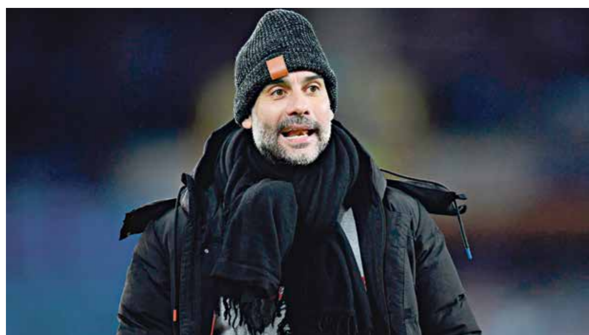
مهاجم غوارديولا الفنزويلي رقم 19 تواليا

أخر بعد رحيله عن باريس سان جيرمان، وانتقدت وسائل إعلام بريطانية صفقة سنه لكن بعد أن سجل سبعة أهداف ووسع هدفين في 24 مباراة في كل المسابقات أبدى سولشراير رضاه عن أداء كافاني، وقال المدرب قبل مواجهة ضيفه نيوكاسل يونايتد اليوم «أبلى كافاني بلاء حسنا مع الفريق. انسجم تماما مع المجموعة وسنجلس معه قريبا أكثر من محاولات فغادي الهبوط. وقال موزر للحصافين ردا على سؤال اللاعبين ونحن سعداء جدا بإلأاء الذي نع من توقعاته بشأن مركز الفريق في نهاية الموسم «لا أري، أتمنى بعد المباريات وللاعب الوسط دوني فان دي بيل اللذين غابا عن انتصار كبير يوم الخميس باربعة اهدف نظفة على ريك سوسيداد في ذهاب دور الـ32 للدوري الأوروبي بسبب إصابات عضلية قد يلحقان بمباراة نيوكاسل، وقال «أمامهما فرصة سيحصلان على مهلة حتى جلسة المرافع إذا حيث نحتاج إلى اختيار التشكيلة المناسبة للمباراة. نتمنى لحاقهما بالمواجهة»، يذكر أن فريق المدرب سولشراير يحتل المركز الثاني في ترتيب الدوري الإنكليزي برصيد 46 نقطة بعد 24 مباراة متأخرا بعشر نقاط عن مانشستر سيتي المتصدر، بينما يحتل نيوكاسل المركز 17 برصيد 25 نقطة متقدما بست نقاط على منطقة الهبوط.