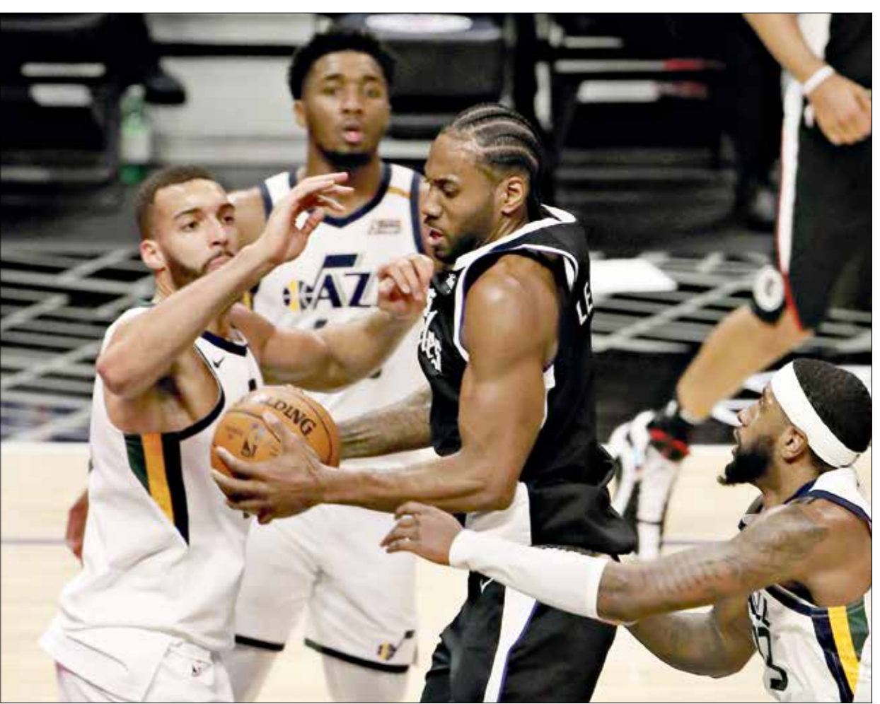
النجم لينارد يفود يفود خريفه الانتصار مهم في الدوربي

تعافى النجم كواهي لينارد من إصابة في ساقه وسجل 29 نقطة لتعود لفرقة لوس أنجلوس كليبرز لتحقيق ثأر سريع من الخضارة أمام فريق يوتا جاز منصنر المنطقة الغربية، الجمعة في دوري كرة السلة الأميركي للمحترفين، في وقت سجل الكندي جمال موراي 50 نقطة تاريخية دون أي رمية حرة، ومع عودة لينارد وأيضا النجم الآخر بول جورج من الإصابة، تحظى كليبرز ضيفه يوتا (116 - 113) بعد يومين من خسارته على الملعب بعينه (114 - 96)، ليوقف سلسلة جميلة من تسعة انتصارات ليوتا جاز، وغاب لينارد، حامل اللقب سابقا مع سان أنطونيو سبيرز وتورونتو رابتنورز، ثلاث مباريات لإصابة في ساقه، في وقت غاب جورج عن سبع مباريات لإصابة