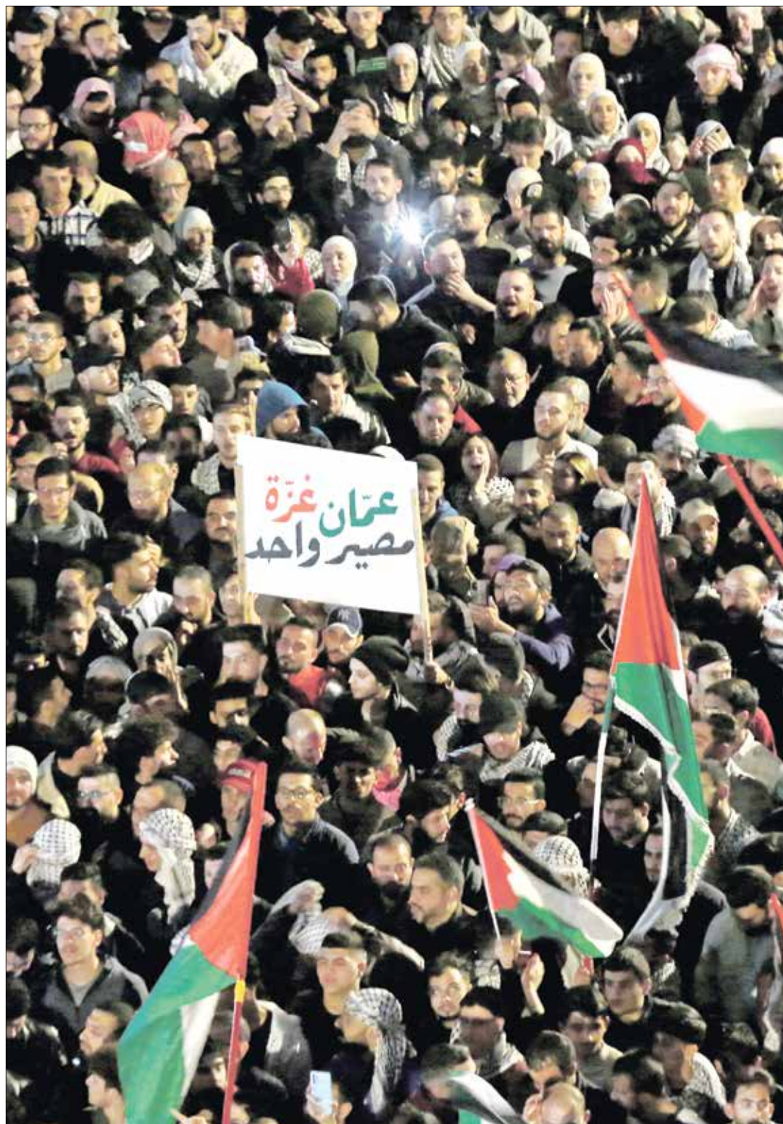
خلال تظاهرة مناصرة للفلسطينيين في عمان، 28 مارس 2024