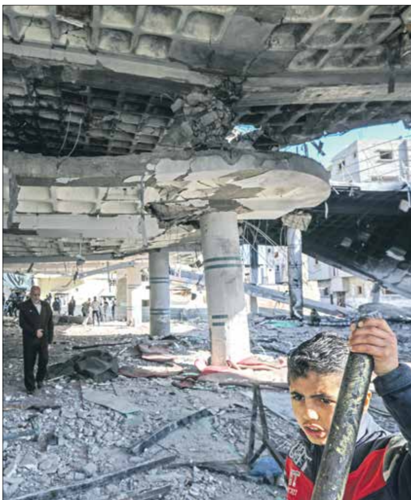
ما يقف من مسجد العبد في ربح بعد الدجم الخطيب