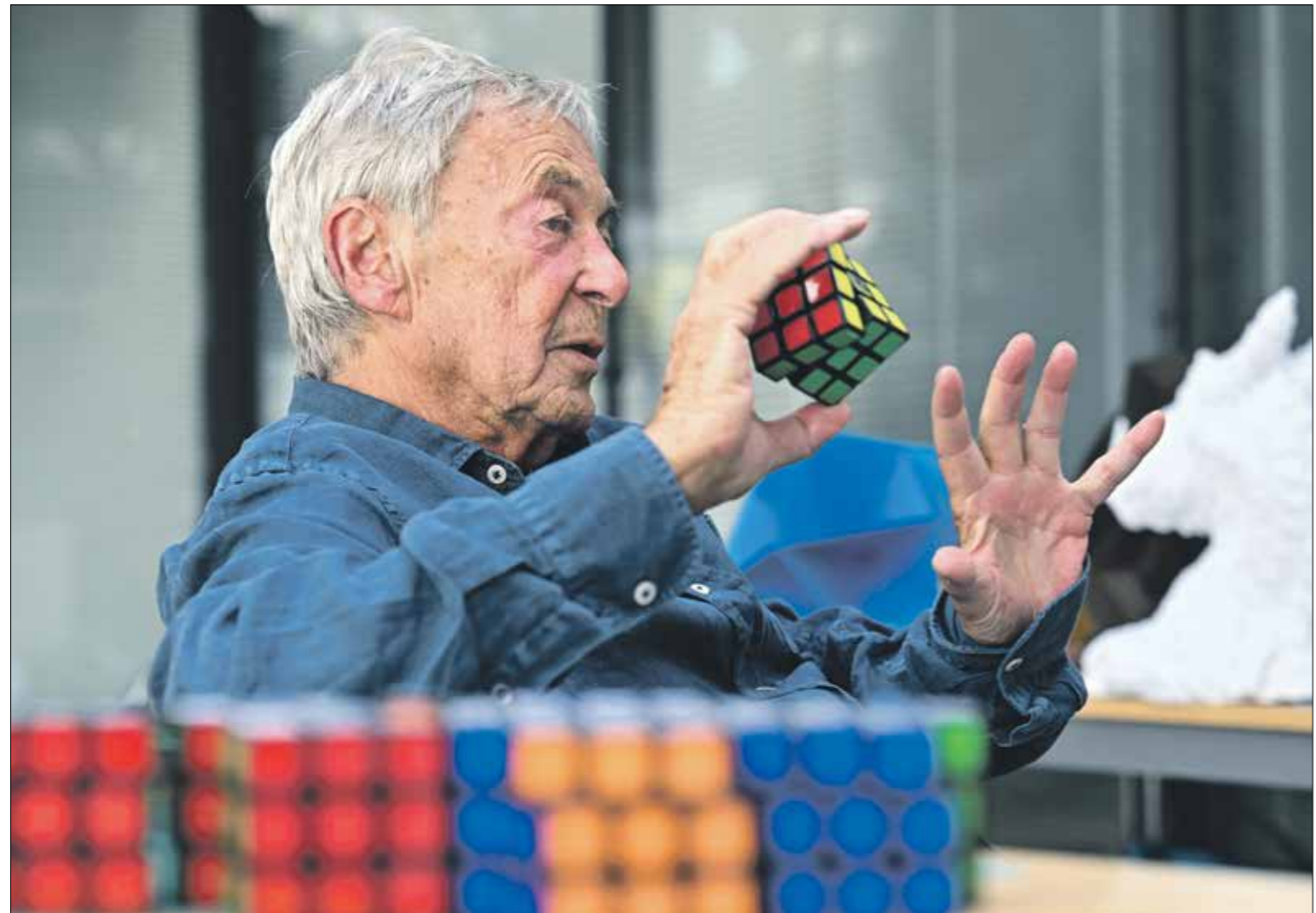
بمؤله المكعب المرحة الساقدية الشاذية روبيك حواسي روبيك

بعد إدانته في قضية اغتصاب، بطارد الناشطون في مواقع التواصل الاجتماعي مشاركات المغني المغربي سعد لمجرد في الحفلات والفعاليات من دولة عربية إلى أخرى. آخر هذه الخطوات عريضة إلكترونية ترفض مشاركة لمجرد في حفلات مغربية، خصوصاً مهرجان موازين، حتى تثبت براءته بطريقة ما عند انتهاء محاكمته في باريس. ويجري توقيع عريضة إلكترونية تطالب بمنع سعد لمجرد من المشاركة في أي حفل في المغرب، وقال نص العريضة: «تطالب السلطات العمومية المغربية بالتحذيل ومنع أي حفل سعد لمجرد إلى حين انتهاء محاكمته». وهي حملة تأتي بعدما أعلن سعد لمجرد عن عودته إلى المشهد المغربي خلال مهرجان موازين». وتقول العريضة: