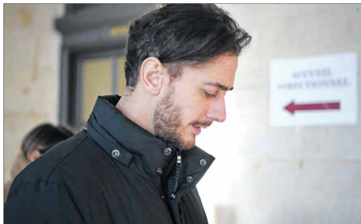
سعد لمجرد في محكمة الجيالات في باريس، 21 فبراير 2023

هذه الحفلات نوع من التطلع مع المتكف وثقافة التعنيف ضد النساء، وتلعب لصورة المتكف، كذلك، في يونيو/ حزيران 2022، دشّن ناشطون على موقع إنس وسم «نرفض سعد لمجرد في جده» قبل حفله في لبنان حفلات الرقص، خصوصاً من النشاطات النسويات اللاتي حذرن من أن