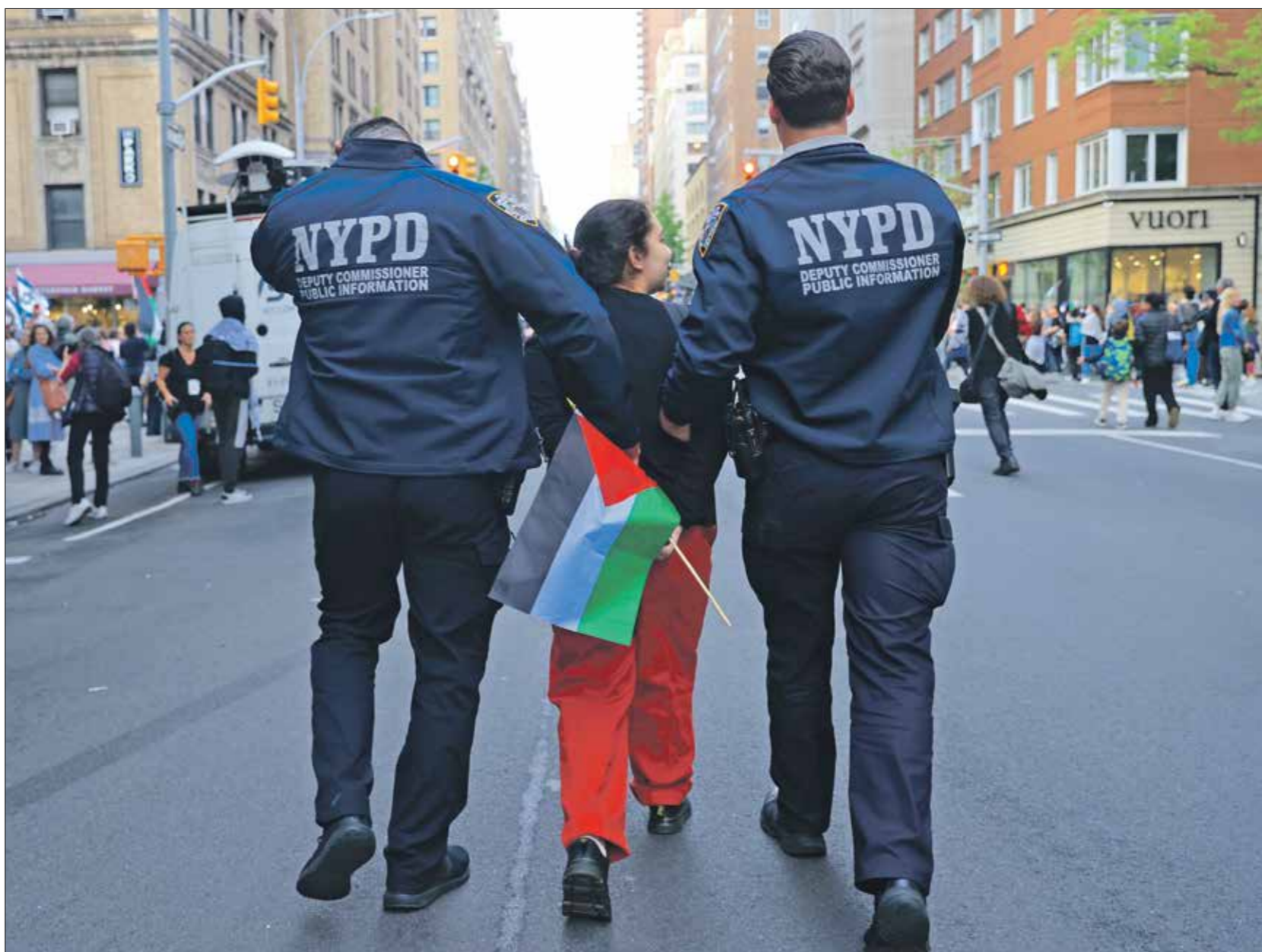
الاء اعلقال مظاهرة متضامنة في نيويورك، 6 مايو 2024 (الاصول)

من صنع القرار في الولايات المتحدة. حفل متروبوليتان هو تقليد سنوي بدأ عام 1948 لجمع التبرعات لصالح المتحف (حتى عام إطلاق هذا التقليد يحمل دلالة مؤلمة للفلسطينيين). اقتصر الحفل منذ ذلك الحين على كبار الأثرياء في المجتمع الأميركي، وانضم إليهم نجوم السينما والغناء ومؤثري مواقع التواصل الاجتماعي لاحقاً نجح هذا الحفل السنوي في إعايش ميزانية المتحف، كما يحظى بإقبال وتغطية إعلامية استثنائية. في هذا الحفل، يلعب نجوم الغناء والسينما عادة دور العارضين والعارضات لأشهر بيوت الموضة وفقاً للتجربة التي تقرها إدارة المتحف، وكانت هذه المرة تحت شعار «هدية الزمن»، بلغ سعر التذكرة الواحدة للحفل هذا العام 75 ألف دولار، أما الطاولة فوصلت إلى 350 ألف دولار. يمكن القول إن حفل متروبوليتان يمثل استعراضاً باهراً للثروة والندخ الأميركيين. هذا التناقض الصارخ بين ما يعمله الحفل والشعارات التي يرفعها المحتجون في الخارج ألهم النشاط بدء حملة واسعة لقاطعة المشاهير، وهي الحملة التي امتد صدامها حتى إلى العالم العربي. استهدفت الحملة الفنانين وأصحاب النفوذ الذين أظهروا دعماً صريحاً للاحتلال الإسرائيلي أو التزموا الصمت إزاء ما يحدث في قطاع غزة. شملت قائمة الحظر التي نشرتها صفحة نحن الجماهير (We The People) على «إنستغرام» جميع الحاضرين البارزين في حفل متروبوليتان، فكل شخص في الحفل متواطئ بدرجة ما في الجريمة التي تحدث في قطاع غزة، كما يقول جون جونسون، أحد مؤسسي الصفحة.