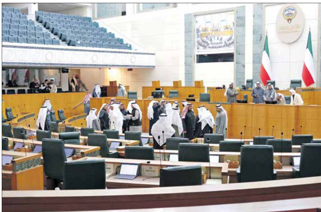
خلال جلسة في مجلس الأمة الكويتي، 16 يناير 2024

تطلق وزارة الإعلام الكويتية «بثاً تجريبياً» لقناة إخبارية مخصصة في يوليو/ تموز المقبل، حرصاً على مواكبة الأحداث المحلية والإقليمية والخارجية، ومن المرجح أن تتبع القناة الجديدة لتلفزيون دولة الكويت الرسمي، والذي يضم سبع قنوات إلى جانب القناة الأولى، وهي القناة الثانية باللغة الإنجليزية، وقناة الرياضية، وقناة الرياضية 2، وقناة دراما، وقناة إشراف، وقناة العربي، وقناة القرنين. وصرح الناطق الرسمي باسم وزارة الإعلام، وكيل قطاع الأخبار والبرامج السياسية بدر العنزي، بعد اجتماع وزير الإعلام والثقافة الكويتي عبد الرحمن المطيري مع قيادات الوزارة، الاثنين، بأن القناة الإخبارية المزمع إنطلاقها في يوليو المقبل تضم «نشرات إخبارية على مدار الساعة»، إلى جانب «موجزات إخبارية وبرامج ثقافية وجوهرية». وأشار العنزي إلى أن سياسة القناة الإخبارية «متوافقة مع السياسة الخارجية لدولة الكويت في ما يتعلق بالقضايا الخارجية»، مضيفاً أنها «ستستخدم أحدث التقنيات في مجال النقل التلفزيوني والتصوير والإخراج في استديوهات تعمل على أعلى المستويات». وأضاف العنزي أن القناة الجديدة «ستعمل على إبراز أهم الأحداث والمنجزات المحلية وتقديمها لتكون واجهة إخبارية للبلاد»، إضافة إلى أنه «من صلب عملها تسليط الضوء إعلامياً على العمل والإنجازات الحكومية وتوضيحها، واتباع توجيهات رئيس مجلس الوزراء الشيخ أحمد عبد الله الأحمد الصباح». وأكد أن القناة المزمع إنطلاقها «تستشير» بخطط أمير الكويت