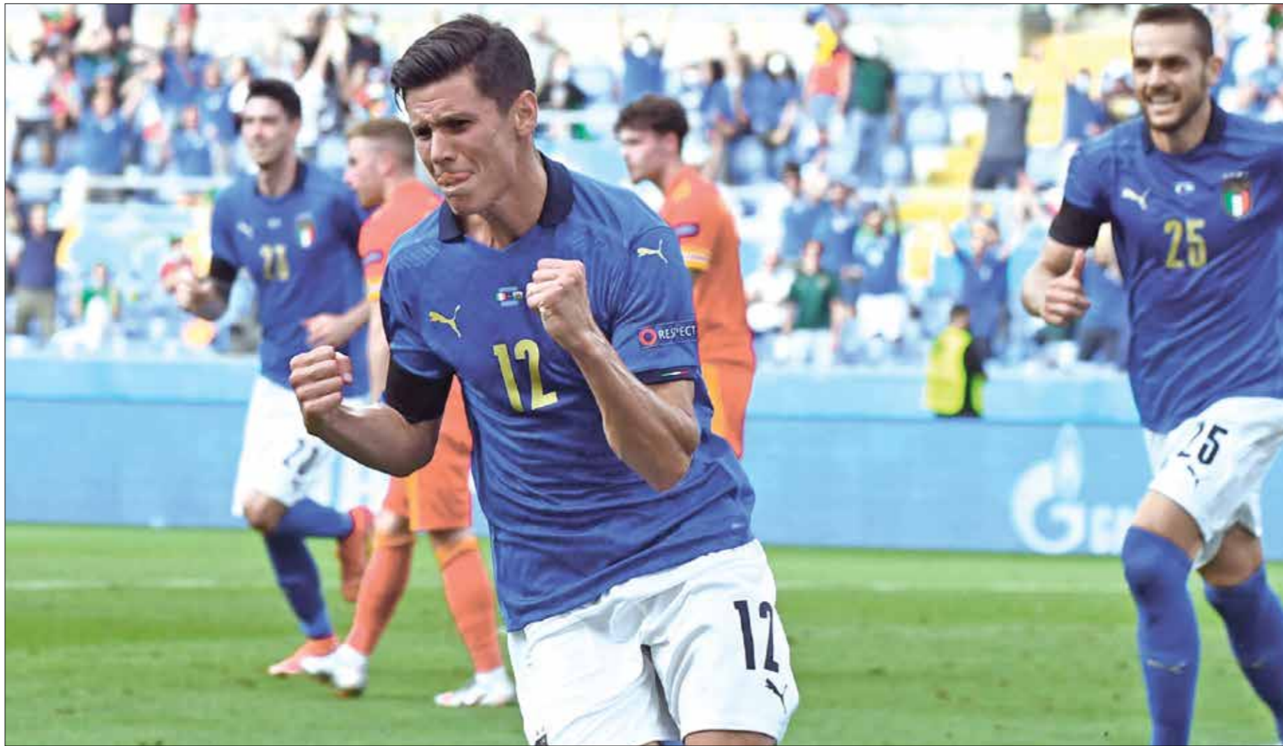
11 فوزا على التتاليين الإيطاليين من دون تلقي أي هدف

إنجلترا بدور السنة عشر في دهما، بفضل فوزها في اللقاء الافتتاحي على كرواتيا، ولا يحتاج أصحاب المركز الثاني سوى التعادل لتأكيد مكانهم في الأدوار الإقصائية، في حين أن الفوز يضعهم في صدارة الترتيب.