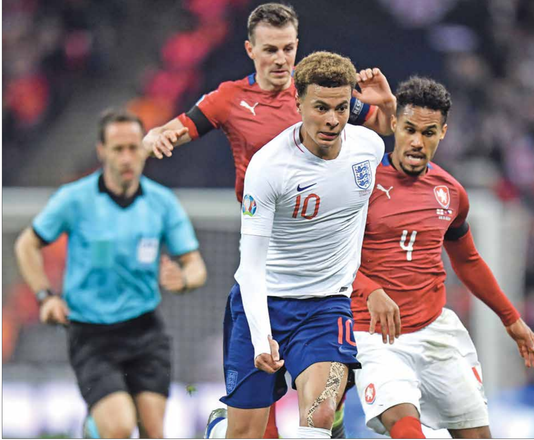
إنجلترا تفوقت على التشيك في ملعب «ويمبلي» عام 2019

وشعر ساوتغيت بالرضا، بعد رؤية فريقه يحافظ على شبابه نظيفة للمرة الرابعة ضد اسكتلندا، فيما سيحاول تكرار الفوز الساحق الذي حققه على جمهورية التشيك 0-5 في أمام المنتخب التشيكي، وأوضح المدير اسكتلندا، طالب زلاتكو داليتش، المدير الفني للمنتخب الكرواتي، بتطوير واضح في أداء الفريق خلال آخر مبارياته في دور المجموعات. وقال داليتش، في المؤتمر الصحافي للقاء: «هذه ليست كرواتيا التي تخيلتها، لكن ما زالت أمامنا فرصة أخيرة». وتعادل المنتخب الكرواتي مع التشيك 1-1، وذلك بعد الخسارة بهدف نظيف أمام كروستيانو رونالدو، برصيد 3 أهداف.