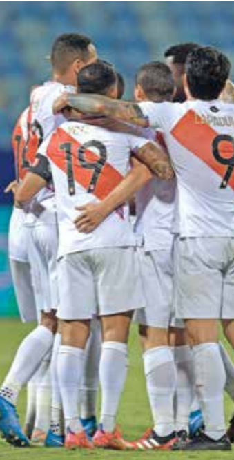
بيرو أحرز فرص تهلها إلى الدور التالي

سقط المنتخب الكولومبي بالنيران الصديقة وفُزط بالتالي بفرصة حسم بطاقة التأهل إلى الدور ربع نهائي من منافسات بطولة «كوبا أميركا» المقامة في البرازيل، وذلك بعد خسارته أمام منتخب بيرو (2 - 1) في نتيجة مفاجئة في غويانا ضمن منافسات الجولة الثالثة من المجموعة الأولى، وكانت الفرصة قائمة أمام كولومبيا للحاق بالبرازيل المصيفة الفائزة بمباراتها الأوليين إلى ربع النهائي، بعدما دخلت لقاء البيرو وفي جمعيتها أربع نقاط من فوزها افتتاحاً على الأكوادور بهدف نظيف ثم تعادلتها سلبي مع فنزويلا في مباراة هيمت عليها تماماً لكنها عجزت عن الوصول إلى الشباك، لكن منتخب بييرو، الذي فني بخسارة قاسية في مباراته الأولى أمام البرازيل برعاية نظيفة، سجل مفاجأة كبيرة وعزز حظوظه ببلوغ الدور ربع النهائي بنيله ثلاث نقاط من مباراتين بفضل هدف عكسي سجله بييري مينا في مرمي منتخب بلاده في الشوط الثاني، ووجدت كولومبيا نفسها متخلفة منذ الدقيقة 17 حين سد