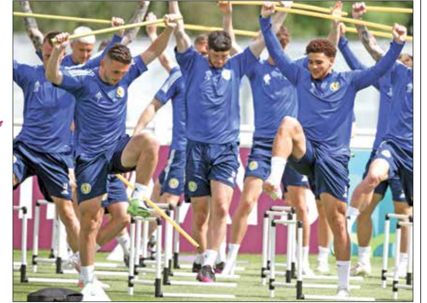
اسكتلندا تملك حظوظا في التأهل إذا فازت على كرواتيا

ستحدد مباريات الجولة الأخيرة للمجموعة الرابعة، المناهلة إلى الدور الثاني من «يورو 2020» من خلال مواجهة منتخب إنجلترا نظيره التشيكي