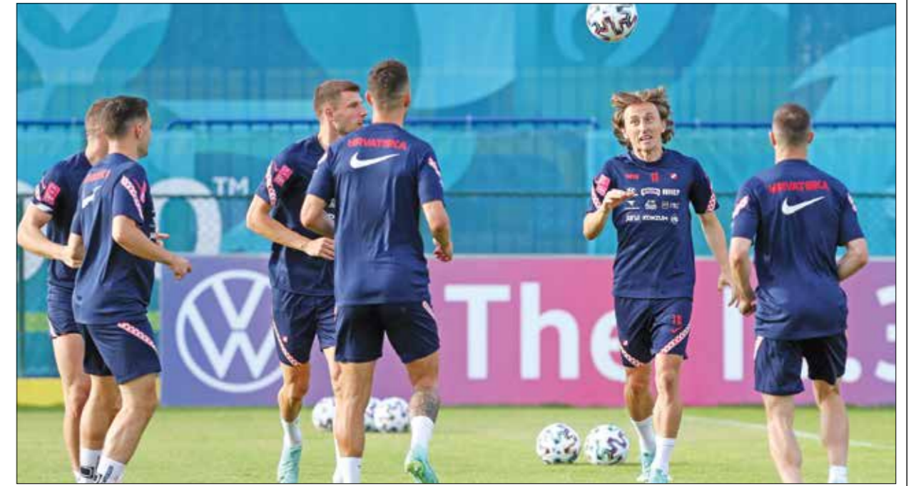
كرواتيا تأمل في خفض بطاقة التأهل