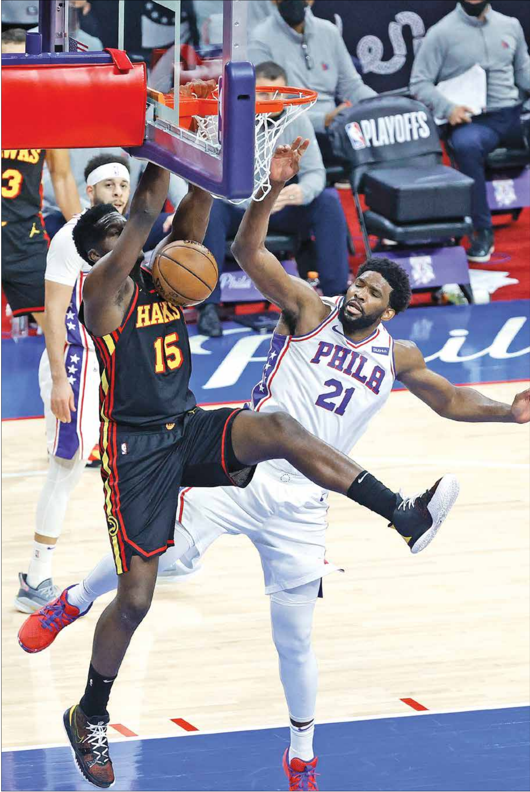
أتلانتا هوكس يسعى للتتويج بلقب الدورى هذا الموسم

انتزع فريق أتلانتا هوكس بطاقة التأهل إلى المباراة النهائية في المنطقة الشرقية للمرة الأولى منذ الأولى منذ 2015، بفوزه في المباراة السابعة من سلسلة نصف النهائي على فيلادلفيا سفنتي سيكسرز (103-96) في «بلاب أوف» دوري كرة السلة الأميركي للمحترفين، الذي شهد أيضاً فوز فينيكس سانز بمباراته الأولى في نهائي المنطقة الغربية.