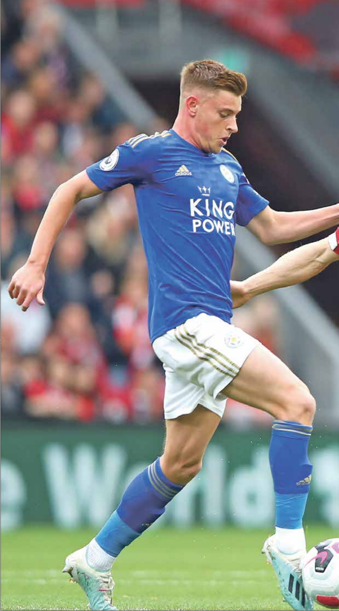
يقبض الصمد عن نجوم ليبريو، عن مواجهة ليستر سيتي

السابق في «الروسونيري»، غينارو غاتوزو. وخلال فترةه الأولى مع الفريق، التي امتدت عامين، فاز إبراهيموفيتش وغاتوزو معا ببلقب الدوري الإيطالي، قبل أن يترك اللاعبين ميلان في عام 2012، بعدما قضى غاتوزو 13 موسماً مع الفريق، وضرب المخضرم إبراهيموفيتش بعامل السن عرض الحائط وسجّل 8 أهداف في 5 مباريات خاضها في الدوري الإيطالي هذا الموسم، وغاب عن