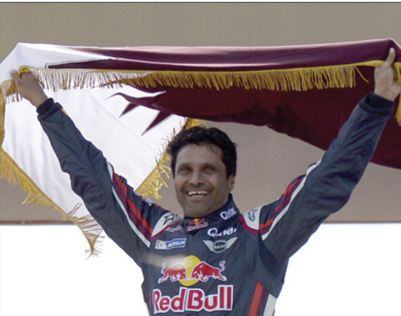
العطية يقابل مع بطولة الشرق الوسط للراليات

كما فإن براليي الأرجنتين وكروبوليس وحلّ ثانياً في رالي دوس سيرتويس البرازيلي، وفي 2009 بعد الإسباني كارلوس ساينز، وخلال مشاركته في رالي داكار 2010، حلّ ثانياً برفاق 2,12 بتدقيقتين عن كارلوس ساينز، مسجلاً أقل فارق في تاريخ السباق بين السائقين الأولين، أما في 15 يناير/ كانون الثاني 2011، احتل ناصر العطية المركز الأول في رالي داكار الأسطوري كأحد سائقي فولكسفاغن الأربعة، وكان بذلك أول عربي يفوز بهذا السباق الصعب عام 2011 والشهير في عالم الرليات الصحراوية.