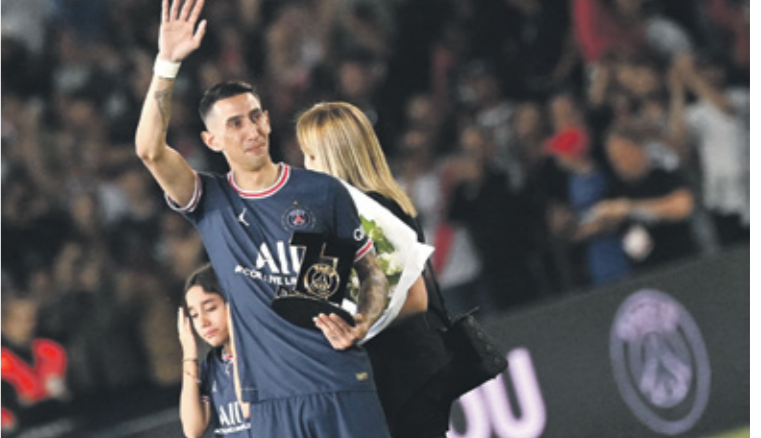
ديف ماريا الهن مشواره مع الفريق الباريسي

سان جيرمان، الذي سيمضي في «بارك دي بريغس» حتى عام 2025، تلمنى كذلك التوقيع للنادي الأبيض في نهائي دوري أبطال أوروبا أمام ليفربول، الذي سيقام في 28 من مايو/ أيار الجاري في باريس، المدينة التي ستحتفل باستمرارية نجاحها الأبرز. ويحتج إدارة الباريسي في إقناع لاعبيها بالبقاء، معتمدة على استراتيجية اتصالية قوية للغاية، حيث لم تسلط عليه ضغطاً طوال الأشهر الماضية، فقد حافظ مبابي على مكانته رغم تردده في تجديد العقد، وكانت تصريحات رئيس النادي