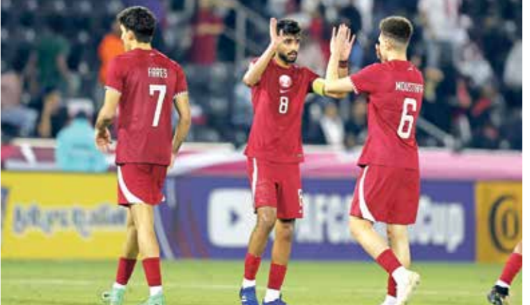
قدّم المنتخب القطري مسلّوهُ قويا دور المجموعات

الإنجازات السابقة: مركز الثّالث واولمبياد 1992