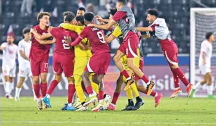
تاهل منتخب قطر بعدما جمع سبع نقاط في الدور الأول

رحلة قطر إلى الدور ربع النهائي بدا منتخب قطر رحلته في بطولة كأس آسيا تحت 23 سنة، نسخة عام 2024، بفوز مهم على منافسه منتخب إندونيسيا بهدفين نظيفين، بحضور حوالي 8867 متشجعا على استاد جاسم بن حمد في الريان، وفي المباراة