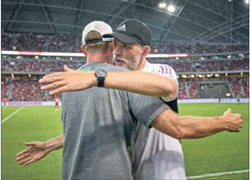
كلوب سيلتزم ليفربول، وتوخيل لن يسلم مع بايرن

ويبدأ ديميكليس مسيرته في عالم التدريب، من بوابة الدوريات الأدنى في النادي بصيفاً خلال نسخة 2009-2010 في مسابقة دوري أبطال أوروبا حين خسر أمام إنتر ميلانو في النهائي، ليخوض تعاقد توماس توخيل في الموسم المقبل، بعدما اتفقت إدارة النادي البافاري على إنهاء التعاقد مع مدرب تشلسي السابق، ليزارد، المشهور، وعلى رأسها لقب الدوري الألماني، الذي حققه في موسم 2023-2024 نادي باير ليفركوزن، بقيادة الإسباني تشابي الونسو، وعلى خطاه يبحث نادي ليفربول الإنكليزي مع نادي شوتغارت، ولحقاً تترد اسم الحالي، الألماني يورغن كلوب، الذي أعلن في شهر يناير/كانون الثاني المنصرم رحلته عن الفريق مع نهاية الموسم المقبل، وذلك بعد يورو 2024، التي ستقام هذا الصيف، الجاري، وذلك بعد مسيرة طويلة استمرت 14 مع 11 تسمية حاسمة، جعلته يخطف الأضواء مع تسمية تشابي الونسو، في الوقت الذي يُعدّ فيه صانع الألعاب الموهوب، أحد نجوم ألمانيا التي ستكون منافسا على لقب بطولة أمم أوروبا، التي ستقام على أرضها الصيف المقبل.