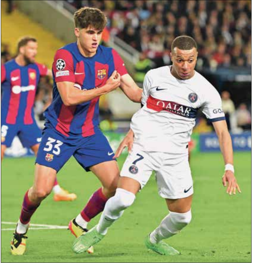
مبابي ياهل بقيادة باريس سانت جيرمان لقب أبطال أوروبا