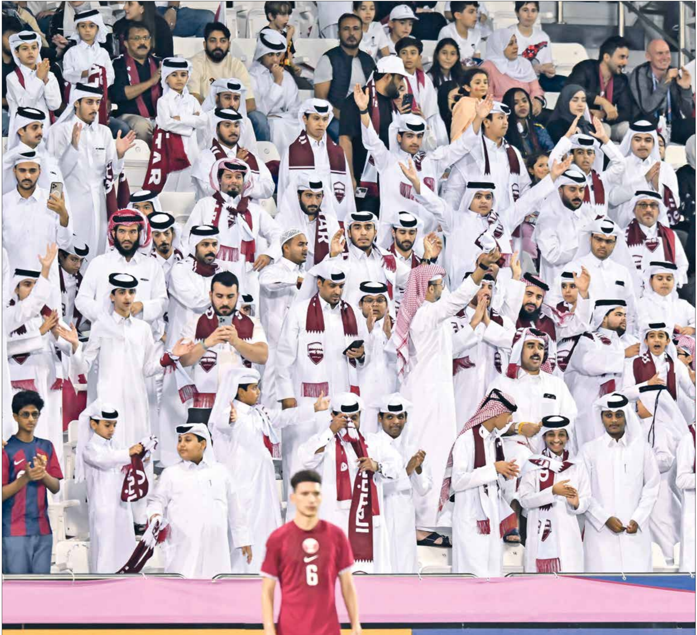
يُصنع منتخب «الطائي» على الجمهور في المدرجات

منتخب كوريا الشمالية وتفوق عليه (2-1)، وفي الدور نصف النهائي خسرت قطر أمام كوريا الشمالية (3-1)، وفي مواجهة تحديد صاحب المركز الثالث، لم يُحالف الحظ قطر الحظ وخسر أمام العراق (2-1)، ولكن في نسخة عام 2018، قدّم المنتخب القطري نسخة استثنائية بدأها بالتاهل من المركز الأول من مجموعته، بعد جمعه تسع نقاط كاملة من الفوز على منتخبات أوزبكستان بهدف نظيف وعمان بهدف نظيف والصين (2-1)، وفي الدور ربع النهائي، تفوق المنتخب القطري