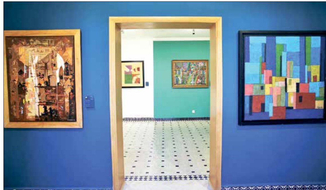
من معرض الافتتاح في «متحف فيلا هاريس»

من الأجيال المعاصرة، القسم الأول من المعرض مخصّص، إذا، لأعمال بعض الرسامين المستشرقين، الذين أنجزوا في المغرب عدداً من لوحاتهم، في نهاية القرن التاسع عشر، من هؤلاء - إضافة إلى ماجوريل ودولاكروا - إيدي لوغران، وكلاوديو برافو، وجاك فيراسات.