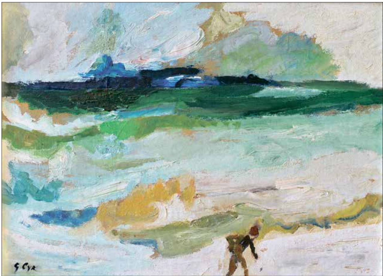
«الشاطئ» ل جورج سير (1880 - 1964)، زيت على لوح