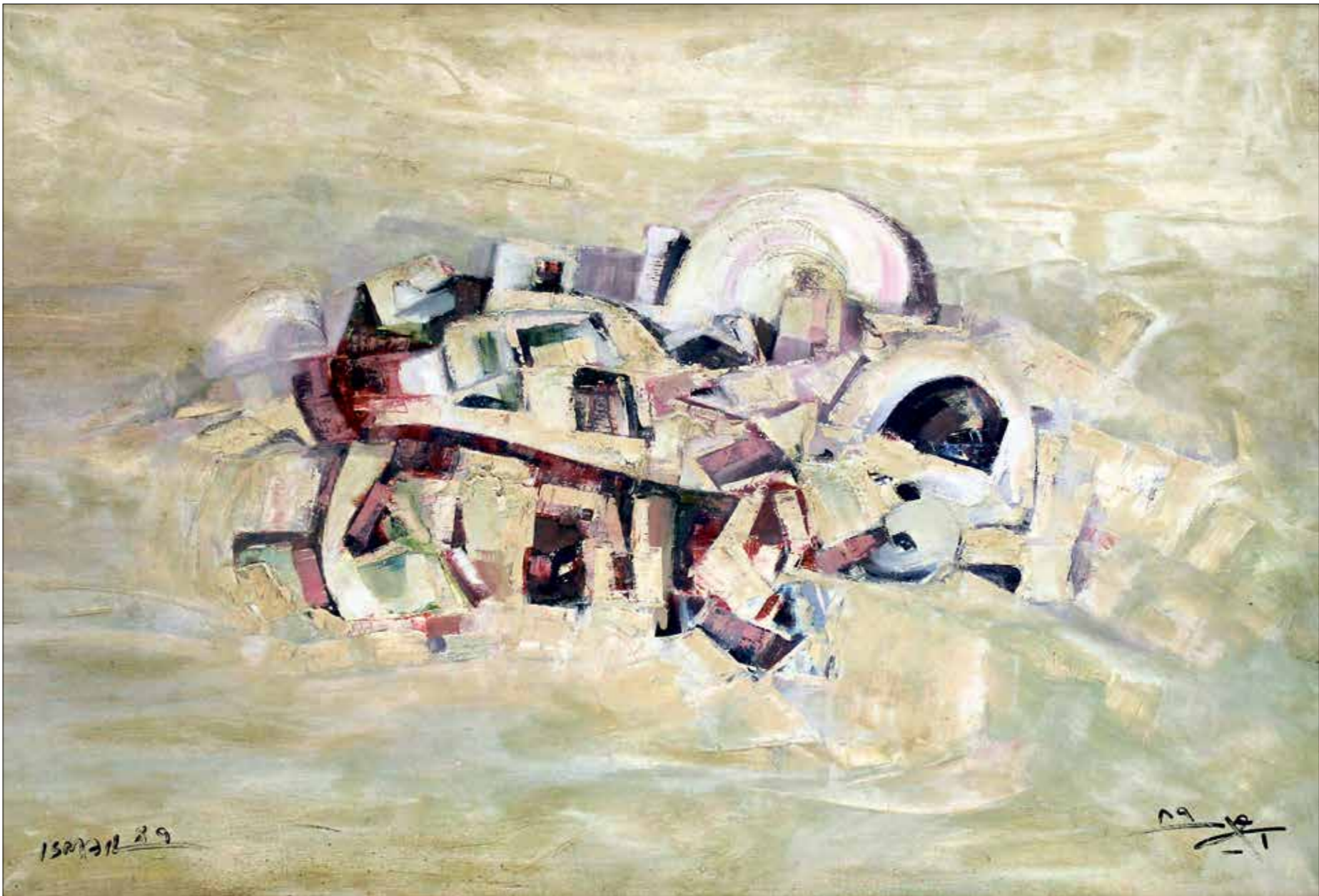
محمد إسماعيل، زيت على قماش، 1989

يشاهد من دواوين الأدب واللغة والتاريخ، الحرائقة والإستشرافية، ذاكرة ما حصل لبعض الخُتاب من الأوهام في شرحها، وتُصلّحها ما وقع في تقريراتهم من الغلط. فلم يخل عمله من تصحيحات لما قاله أساطين اللغة القدماء، مثل ابن منظور، والجوهري، والخبر وزبادي، ولما قاله معاصروه من اللغويين والمستعربين.