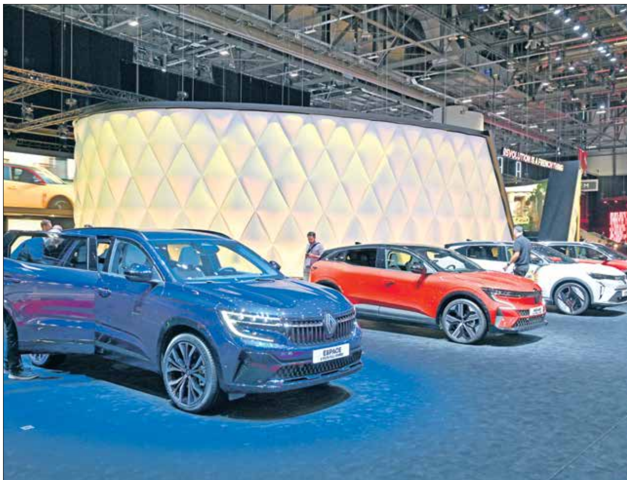
Renault Espace E-Tech الهجينة (يسار) و Megane E-Tech الكهربائية بالكامل (وسط) في معرض جنيف 2024، 26 فبراير 2024

في IONIQ 5 راحة ملحوظة، في حين لا يمكن التفوق على أدائها، حيث تتسارع نسخة الدفع الرباعي من صفر إلى 100 كيلومترات في الساعة خلال 5,1 ثوان. 7 - نيسان ليف: تستمر نيسان ليف، الرائدة في مجال السيارات الكهربائية الاستهلاكية، في إثارة الإعجاب في عام 2024 بمزيجها المتوازن بين التطبيق العملي والأداء. وتقدم هذه السيارة الكهربائية المدمجة مدى تقديرياً يصل إلى 342 كيلومتراً لإصدار SV Plus، مما يلبي احتياجات معظم سائقي المدن والضواحي. مع خرج طاقة يصل إلى 214 حصاناً، تضمن ليف قيادة ديناميكية وسهلة. والتصميم الداخلي الفسيح والحديث لسيارة ليف، بمقاعد الخسنة الحقيقية وصندوقها الخلفي الكبير سعة 435 لترًا، يجعلها خياراً حكيمًا للعائلات. ولا تُستثنى التكنولوجيا، مع شاشة تعمل باللمس مقاس 8 بوصات تدمج