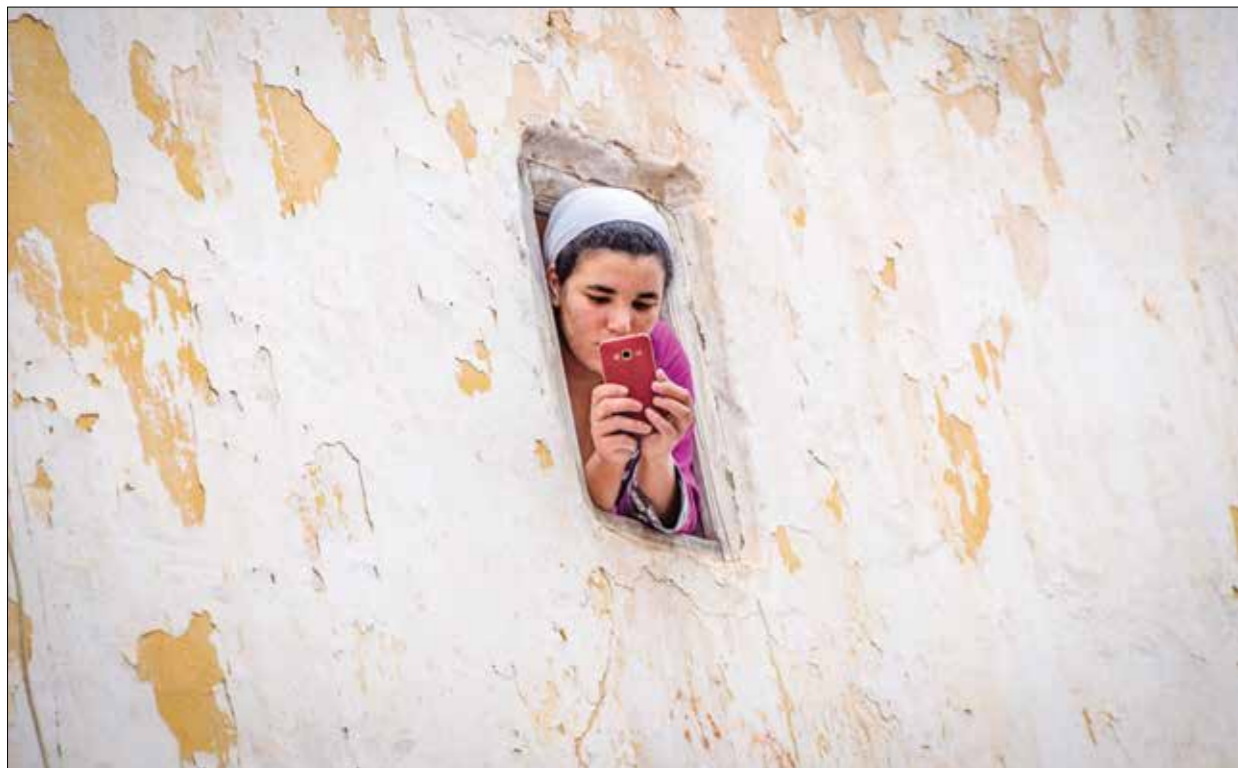
تعد الاستراتيجة إطلاق خدمة الجيل الخامس مع الإنترنت

اعلنت وزارة الانتقال الرقمي المغربية عن استراتيجية «المغرب الرقمي 2030»، وهي خطة تهدف إلى رقمنة الخدمات العامة وتنمية الاقتصاد الرقمي ودعم الشركات الناشئة وتعزيز الخدمات في البلاد. وتشتمل الاستراتيجية تحسين مؤشرات الخدمات وتطوير التصدير الرقمي والإنترنت وتعزيز السيادة الرقمية والحاق بركب الذكاء الاصطناعي. ومن مهام الاستراتيجية تحسين تصنيف المغرب في مؤشرات الخدمات العامة، على أمل الخروج من المركز الحالي إلى ال50 عالمياً في أفق 2030. وتقول الاستراتيجية إنها تعمل على رقمنة الخدمات العامة وتيسر لرفع نسبة رضا المستخدمين إلى أكثر من 80% من خلال تقليص أجال الإجراءات الإدارية 50%، وتبسيط الوثائق اللازمة ومراحل إنجازها بنسبة 40%. كما تعد «المغرب الرقمي 2030» برقع إيرادات التصدير الرقمي (الأوتوسورسینگ)،