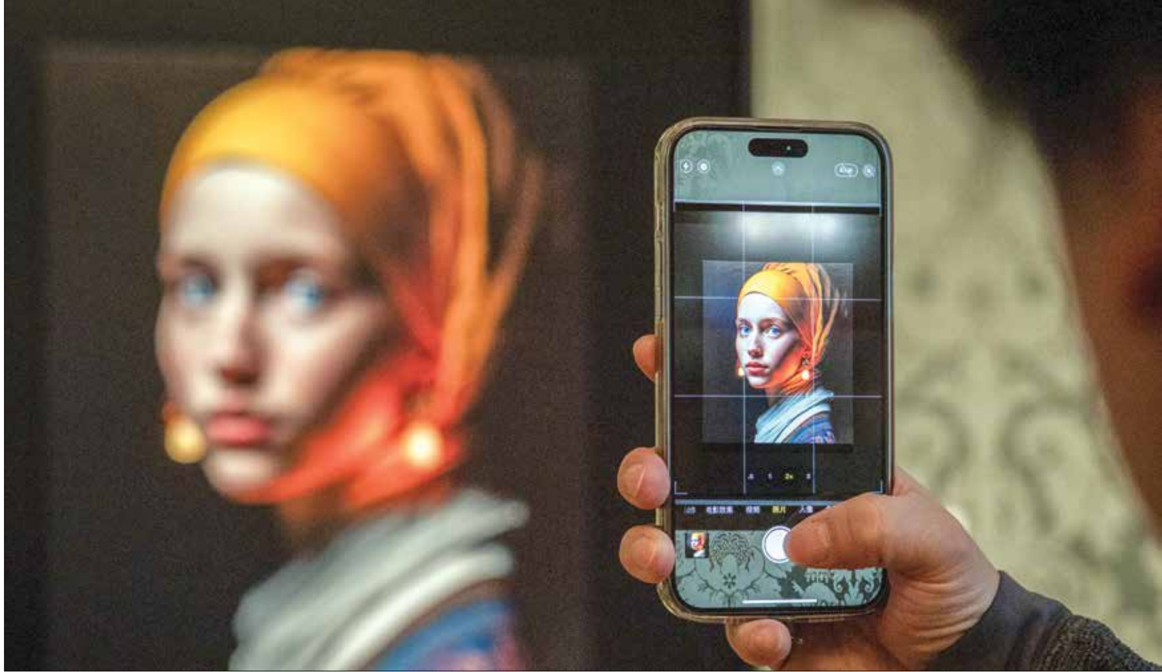
صورة مصممة بالذكاء الاصطناعي في متحف ماورنشاوس في لاهاي

يثير الذكاء الاصطناعي مخاوف بيئية وبشرية واقتصادية دفعت باحثين إلى دعوة لوقف تطويره مؤقتاً لتقييم مخاطره، فيما تسعى الأمم المتحدة إلى تنظيم الذكاء الاصطناعي على مستوى عالمي