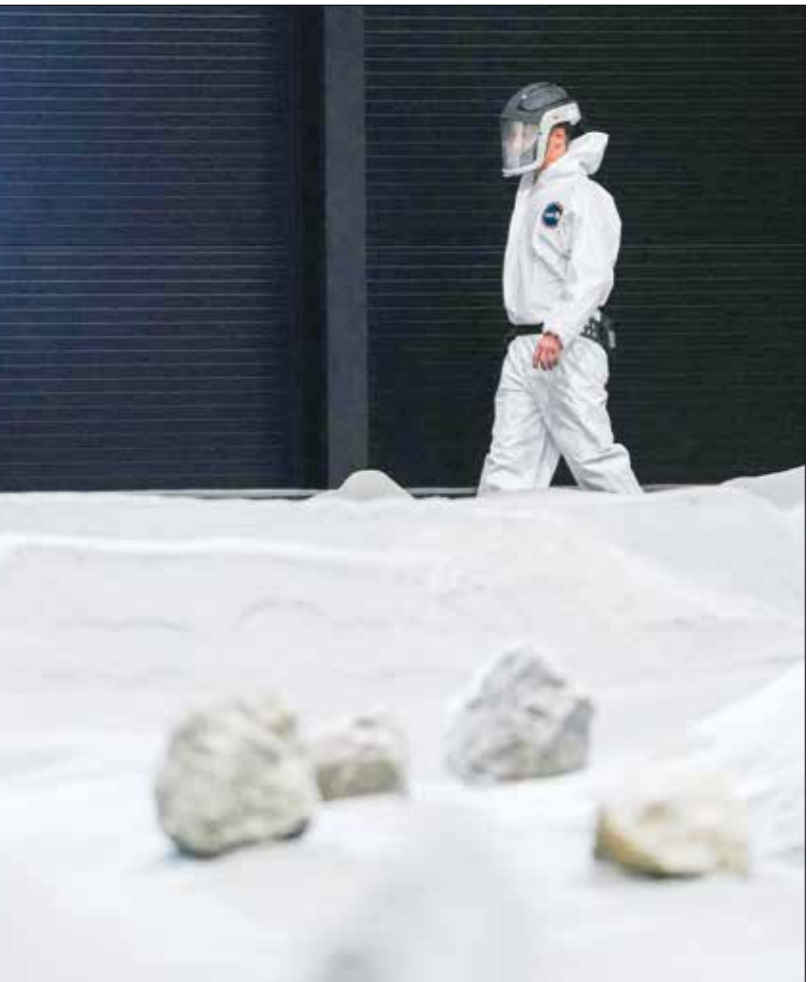
تؤمّر مساحة تحت الأرض للاختيار أفضايات استخدام التمر

الإضطرار إلى شراء 900 طن من الولايات المتحدة، ابتكرت وكالة الفضاء الأوروبية مادة تسمى «إي إيه سي- 1 إيه» (EAC-1A)، مساوية للثرى القمر، وهي الطبقة السميكة من الغبار التي تغطي النجم لامتار عدة. وهذا الغبار خشن للملمس كحجر الخفاف، ويجعله صفر حبيباته، إضافة إلى طبيعته الكاشطة، خطيراً على الجهاز التنفسي وعلى المعدات. عندما يمشي عليه المرء، «يرتفع ويطفو» في الهواء»، بحسب ماتياس ماوريير، أما على سطح القمر، فيسبب الثرى مشكلات أكبر، نظراً إلى كونه مشحوناً بالكهرباء الساكنة، ما يجعله يلتصق بأي سطح. لدرجة أن رواد الفضاء في بعثات «بولفو» كانوا يخشون أن يتأثر العزل المائني لزيارتهم الفضائية بعد ثلاث رحلات فقط. ويتأثر الثرى على القمر من عدل إلى بعضي من اصطدامات الكويكبات بالقشرة القمرية، وصرح مدير مشروع «الونّا» في وكالة الفضاء الأوروبية يورغن شلوتز أن الثرى في المركز الأرضي عبارة عن «مادة بازلتية بركانية تخرن وتُخلّط تمّ تخلّط»، وينتج هذا المزيج الذكي من موقع بركاني المائي